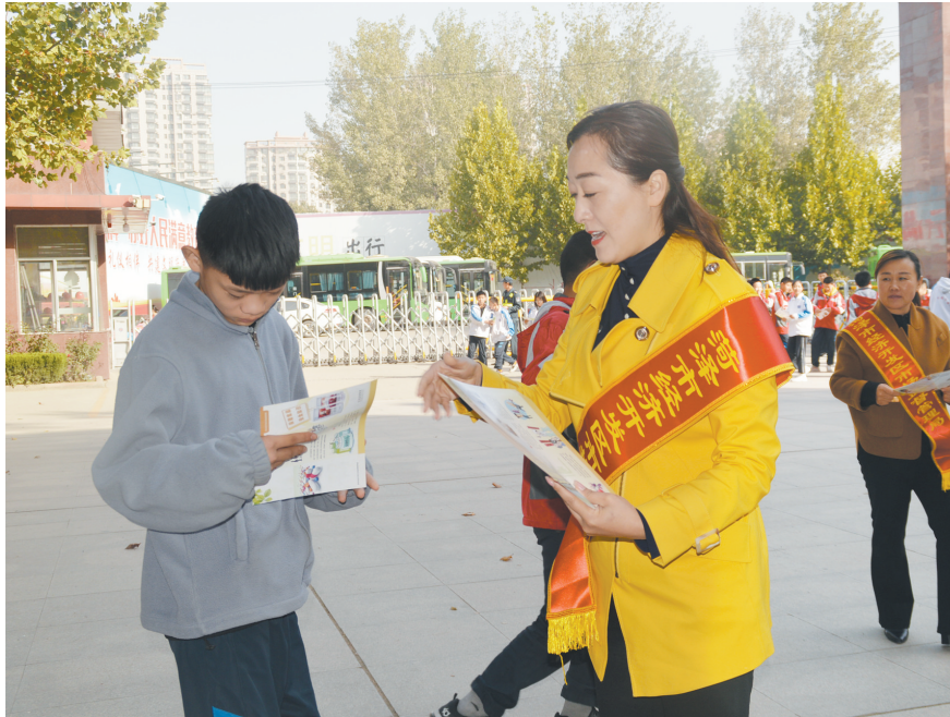
近日,市开发区市场监管局工作人员到广州路中学开展“食品安全知识进校园”主题宣传活动,现场向学生发放食品安全知识读本,引导学生自觉抵制不健康食品。