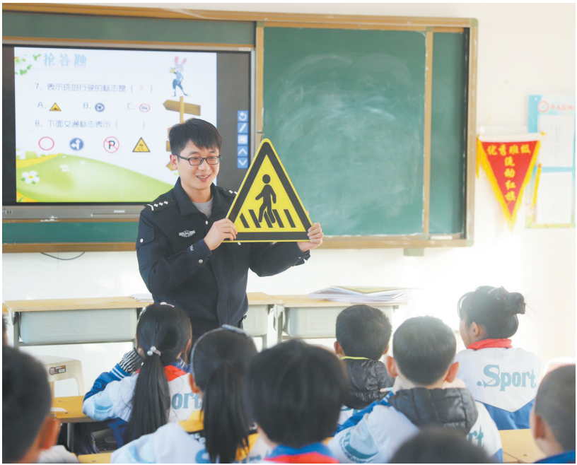
近日,市开发区交警大队宣传科联合佃户屯中队民警走进舜秀路小学,开展交通安全主题宣传,为校园撑起“平安保护伞”。

活动中,宣传民警针对学生的年龄特点,运用课件讲解、观看视频、趣味问答的方式,重点围绕行人不走斑马线、非机动车闯红灯所引发的交通事故危害,以及如何提高自我防范能力等方面展开。