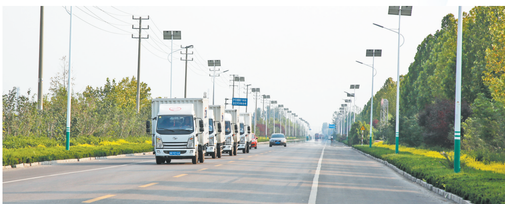
推进交邮合作战略