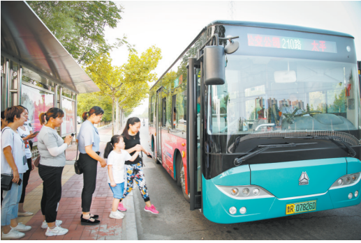
实施城乡公交一体化

目、金山文旅特色小镇建设全面深入,乡村旅游建设未来可期;助力扶贫攻坚。完成了全县 357 个省定扶贫村的道路建设;依托良好的农村路网,一个个扶贫大棚、扶贫车间、农业产业园、电商基地、书画产业园建成达产……多元举措下,精准扶贫和交通发展相得益彰。 “四好农村路”是民心工程,是富民强国路。巨野县将更加扎实地贯彻落实习近平总书记关于“四好农村路”建设的重要批示指示精神,进一步完善体制机制,强化措施落实,稳定投入,驰而不息地推动“四好农村路”建设工作持续高质量发展。 (本版图片均为资料片) 文/图 通讯员 张少华