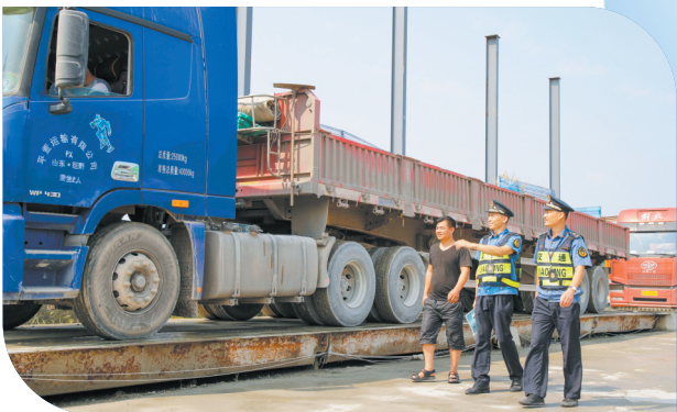
源头管理货运车辆