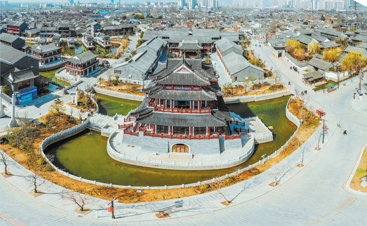
河下古镇