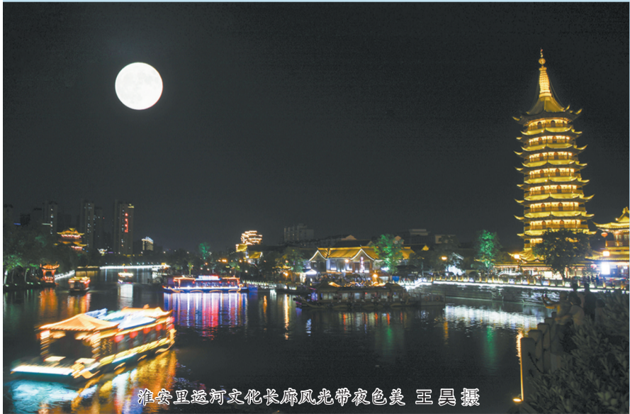
淮安里运河文化长廊风光带夜色美