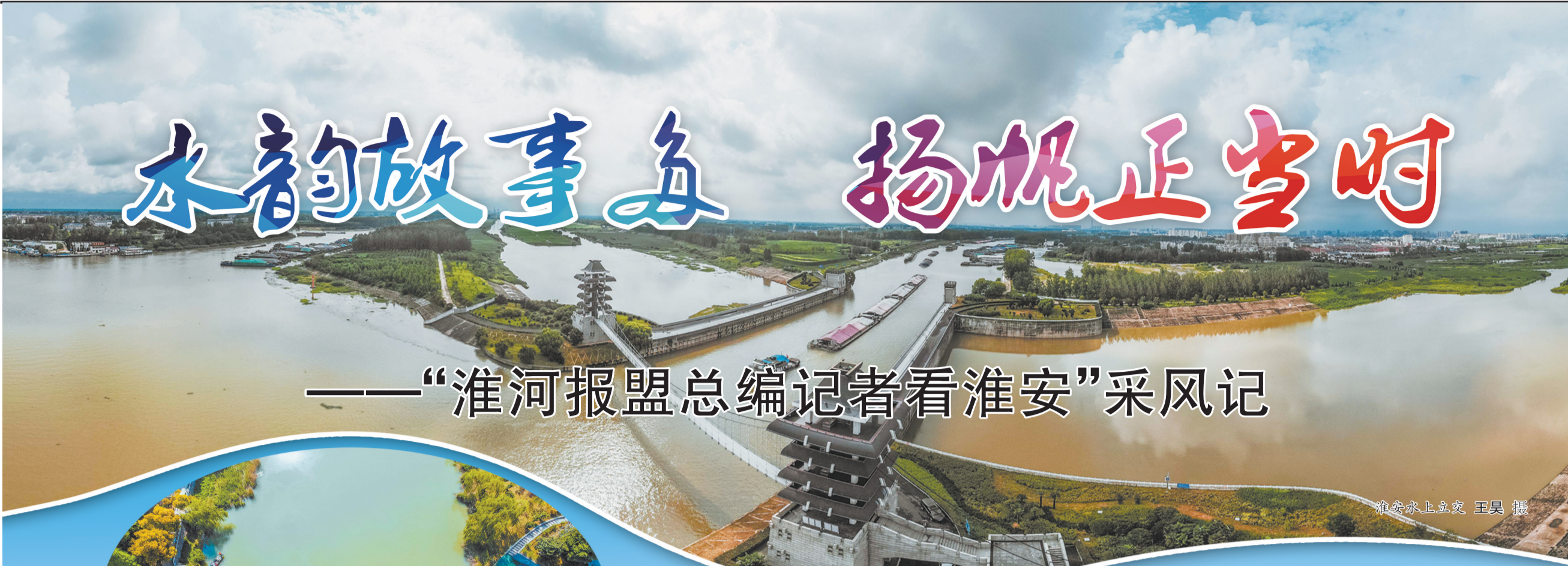
淮安水上立交