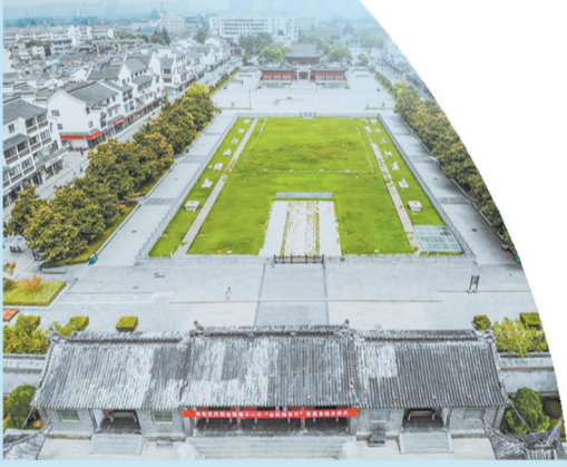
漕运总督府遗址