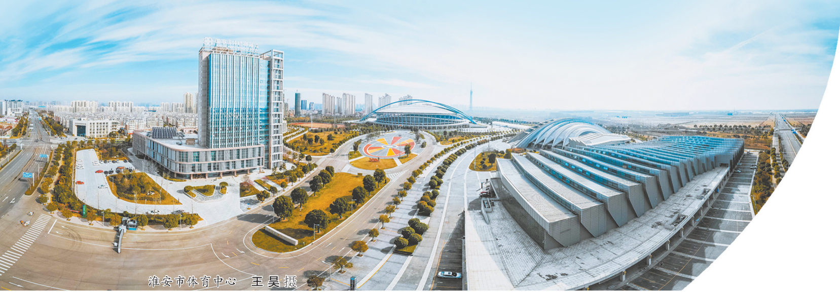
淮安市体育中心