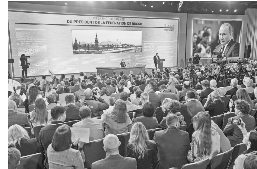
12月19日，俄罗斯总统普京在莫斯科召开年度记者会。