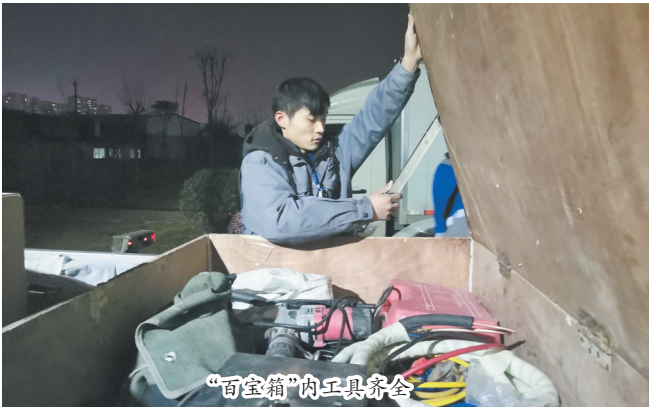
“百宝箱”内工具齐备