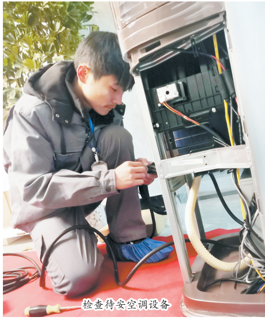
检查待安空调设备