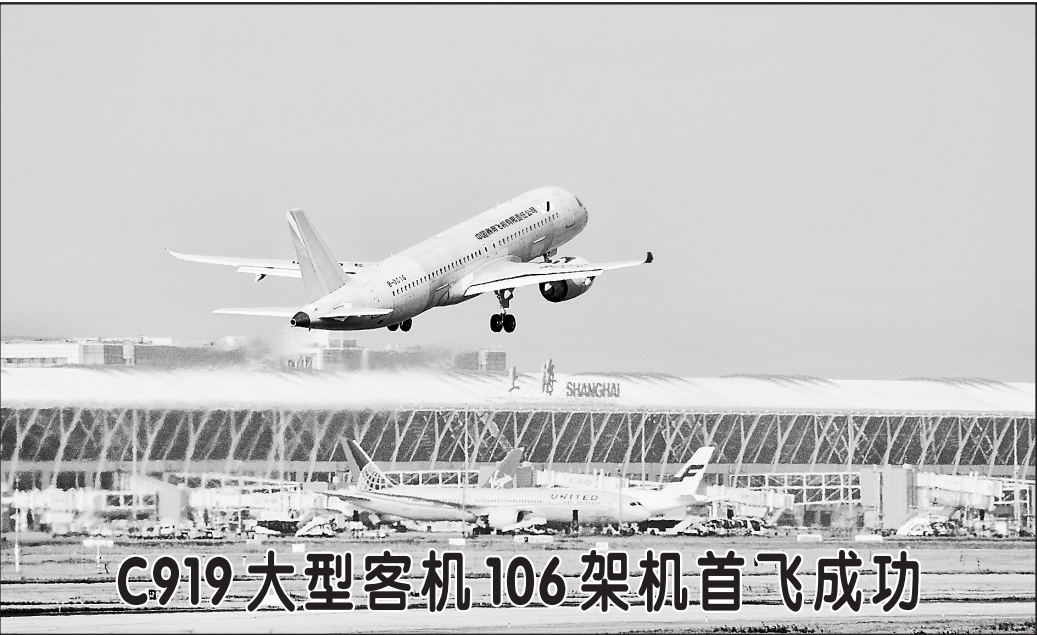
12月27日，C919大型客机106架机在上海浦东机场起飞。当日10时15分，C919大型客机106架机从上海浦东机场第四跑道起飞，经过2小时5分钟的飞行，在完成了30个试验点后，于12时20分返航并平稳降落在上海浦东机场，顺利完成其首次飞行任务。至此，C919大型客机6架试飞飞机已全部投入试飞工作，项目正式进入“6机4地”大强度试飞阶段。

习近平强调，在这次专题民主生活会上，中央政治局的同志主动找差距、找不足，就做好工作提了许多很好的意见和建议，有的涉及中央工作，有的涉及部门工作，有的涉及地方工作，会后要抓紧研究、拿出举措、改进工作，务求取得实效。