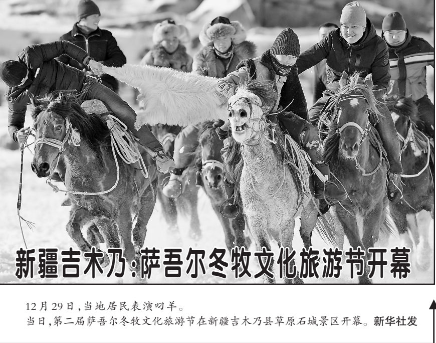
12月29日,当地居民表演叼羊。当日,第二届萨吾尔冬牧文化旅游节在新疆吉木乃县草原石城景区开幕。

新华社北京12月28日电(记者 杨维汉 陈菲)十三届全国人大常委会第十五次会议28日表决通过了关于召开十三届全国人大三次会议的决定。根据决定,十三届全国人大三次会议将于2020年3月5日在京召开。 决定建议十三届全国人大三次会议 的议程是:审议政府工作报告;审查2019年国民经济和社会发展计划执行情况与2020年国民经济和社会发展计划草案的报告、2020年国民经济和社会发展计划草案;审查2019年中央和地方预算执行情况与2020年中央和地方预算草案的报告、2020年中央和地方预算草案;审议全国人民代表大会常务委员会关于提请审议《中华人民共和国民法典(草案)》的议案;审议全国人民代表大会常务委 会工作报告;审议最高人民法院工作报告;审议最高人民检察院工作报告等。 中央和地方预算草案;审议全国人民代表大会常务委员会关于提请审议《中华人民共和国民法典(草案)》的议案;审议全国人民代表大会常务委 会工作报告;审议最高人民法院工作报告;审议最高人民检察院工作报告等。