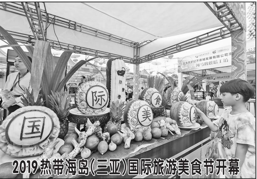
12月29日,一名小朋友在美食节上观看食雕作品。当日,2019热带海岛(三亚)国际旅游美食节在海南三亚开幕,活动将持续至2020年1月1日。

(按事件发生时间先后为序) 受洗礼、干事创业敢担当、为民服务解难题、清正廉洁作表率作为具体目标,在全党分两批展开。以县处级以上领导干部为重点在全党开展的这次主题教育,是推动全面从严治党向纵深发展、把党的自我革命推向深入的重大举措。 4、国家重大区域战略进一步完善 9月18日,习近平总书记在郑州主持召开座谈会并发表重要讲话,将黄河流域生态保护和高质量发展,同京津冀协同发展、长江经济带发展、粤港澳大湾区建设、长三角一体化发展并列为重大国家战略。《粤港澳大湾区发展规划纲要》《长江三角洲区域一体化发展规划纲要》等出台实施,雄安新区建设稳步推进,深圳开启中国特色社会主义先行示范区建设进程,推进海南全面深化改革开放各项举措落地实施,推动西部大开发形成新格局,支持东北地区深化改革创新推动高质量发展取得进展,推动中部地区高质量发展取得新成效,促进东部地区实现率先发展,区域协调发展向纵深推进。 5、北京大兴国际机场等一批重大项目成功实施 9月25日,北京大兴国际机场正式投 运,远期满足年旅客吞吐量1亿人次以上的需求。12月17日,我国第一艘国产航空母舰山东舰交付海军。一年来,一批重大项目不断取得新成果:5G商用牌照正式发放;嫦娥四号探测器实现人类探测器首次月背软着陆;长征五号运载火箭成功发射实践二十号卫星;到今年底,铁路营业里程达到13.9万公里以上,其中高铁3.5万公里,居世界第一。 6、国之大典隆重庆祝新中国70华诞 10月1日上午,庆祝中华人民共和国成立70周年大会在北京天安门广场隆重举行,20余万军民以盛大的阅兵仪式和群众游行欢庆新中国70华诞。中共中央总书记、国家主席、中央军委主席习近平发表重要讲话并检阅受阅部队。1日晚,庆祝中华人民共和国成立70周年联欢活动在北京天安门广场盛大举行。国庆70周年庆祝活动是国之大典,气势恢弘、大度雍容、纲维有序、礼乐交融,充分展示了新中国成立70年来的辉煌成就,有力彰显了国威军威,极大振奋了民族精神。 7、中共十九届四中全会擘画“中国之治”新蓝图 10月28日至31日,中共十九届四中 全会在北京召开。会议审议通过《中共中央关于坚持和完善中国特色社会主义制度、推进国家治理体系和治理能力现代化若干重大问题的决定》,全面总结中国特色社会主义制度建设的历史性成就,集中概括中国特色社会主义制度和中国特色国家治理体系的显著优势,深刻阐述支撑中国特色社会主义制度的根本制度、基本制度、重要制度,明确了坚持和完善中国特色社会主义制度、推进国家治理体系和治理能力现代化的总体要求、总体目标和重点任务。 8、中国经济稳中向好逆风前行 12月10日至12日,中央经济工作会议在京举行。会议认为,今年以来,面对国内外风险挑战明显上升的复杂局面,在以习近平总书记为核心的党中央坚强领导下,全党全国贯彻党中央决策部署,坚持稳中求进工作总基调,坚持以供给侧结构性改革为主线,推动高质量发展,扎实做好“六稳”工作,保持经济社会持续健康发展,“十三五”规划主要指标进度符合预期,全面建成小康社会取得新的重大进展。全年发展主要目标任务能够较好完成,经济增速在主要经济体中位居前列,预计减少贫困人口