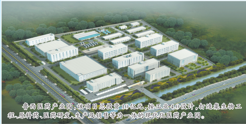
鲁西医药产业园,该项目总投资10亿元,按工业4.0设计,打造集生物工程、原料药、医药研发、生产及销售等为一体的现代化医药产业园。

鄆城县集中开工的31个重点项目,总投资252.3亿元,其中投资10亿元以上的项目11个,数量占35.5%,投资额占69.2%。这些项目涵盖生物医药、机电设备制造、农副产品加工、商贸物流、文化旅游、社会民生等多个领域,既有强龙头、补链条的实体经济项目,又有补短板、惠民生的保障类项目,项目建成后,将成为推动鄆城高质量发展的重要引擎。