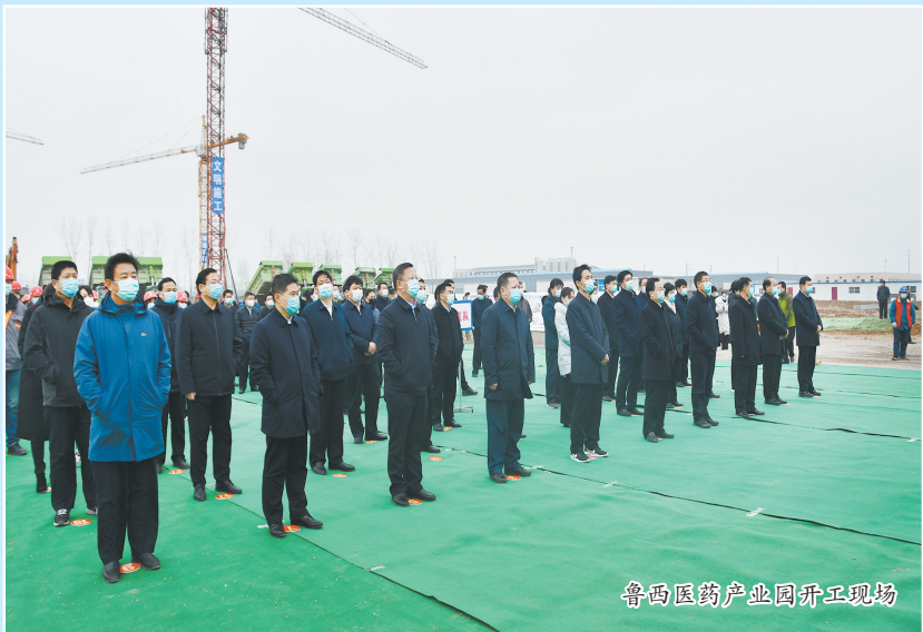
鲁西医药产业园开工现场