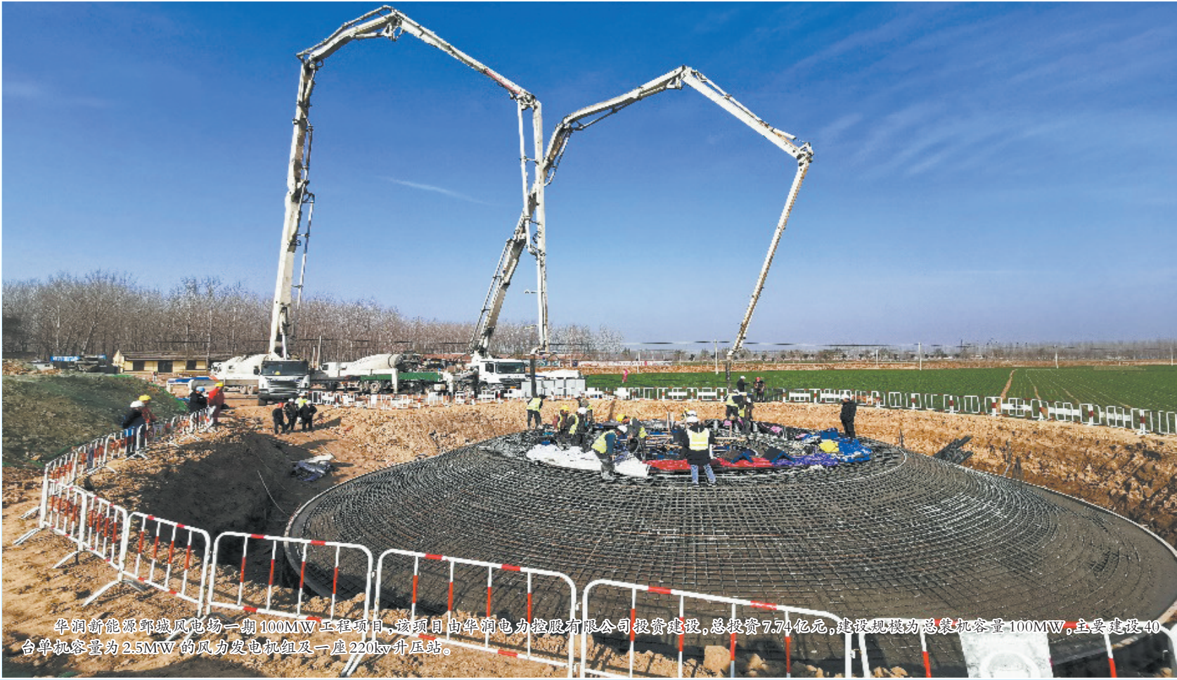
华润新能源鄆城风电场一期100MW工程项目,该项目由华润电力控股有限公司投资建设,总投资7.74亿元,建设规模为总装机容量100MW,主要建设40台单机容量为2.5MW的风力发电机组及一座220kv升压站。

鄆城县集中开工的31个重点项目,总投资252.3亿元,其中投资10亿元以上的项目11个,数量占35.5%,投资额占69.2%。这些项目涵盖生物医药、机电设备制造、农副产品加工、商贸物流、文化旅游、社会民生等多个领域,既有强龙头、补链条的实体经济项目,又有补短板、惠民生的保障类项目,项目建成后,将成为推动鄆城高质量发展的重要引擎。