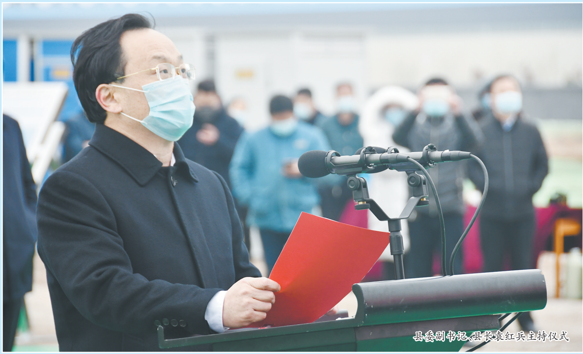
县委副书记、县长袁红兵主持仪式