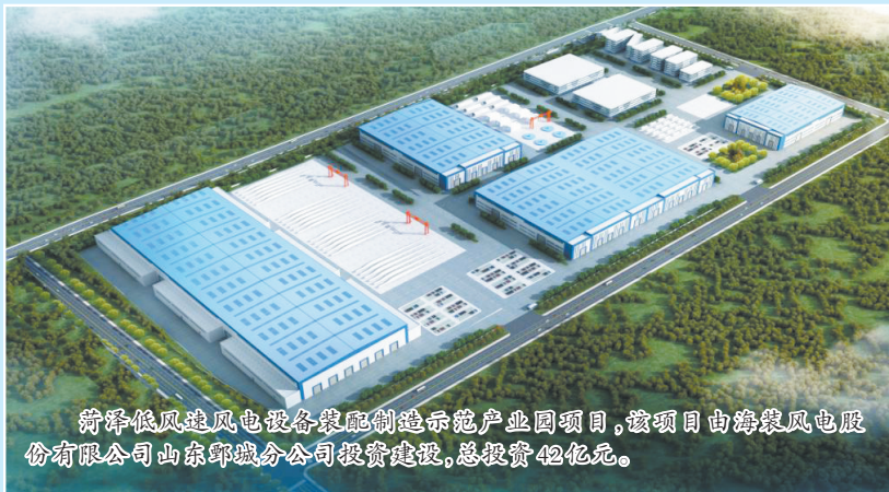
新泽低风速风电设备装备制造示范产业园项目,该项目由海装风电股份有限公司山东鄆城分公司投资建设,总投资12亿元。