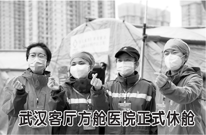
3月8日，武汉客厅方舱医院的医疗队队员合影留念。当日，武汉客厅方舱医院正式休舱。

习近平强调，各级党委和政府要关心关爱疫情防控一线党员和各族各界妇女同胞，大力宣传防疫抗疫一线的巾帼典型，激励和支持亿万妇女为打赢疫情防控人民战争、总体战、阻击战贡献智慧和力量。