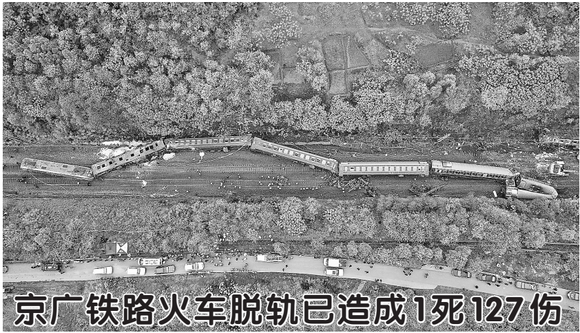
京广铁路火车脱轨已造成1死127伤

据新华社北京3月30日电（记者 史竞男）商务印书馆语言资源知识服务平台（“涵芬”App）30日在京正式上线。该平台是国内首个基于权威工具书开发的语言学习服务平台，融合人工智能、自然语言处理和大数据分析等技术，具备词典查询、名著阅读、写作指导、经典讲析、传统文化学习等功能。 此外，平台收录了多部名家名师原创精品课程，支持文字、音频、视频多种学习模式，提供综合性语文学习服务。 商务印书馆有关负责人表示，在融合出版新时代背景下，该平台上线运营标志着语言资源知识服务进入新阶段。平台还将增加英语和其他外语工具书以及基于工具书的英语阅读产品。 该平台自发布之日起至今年4月底，免费向全社会开放。