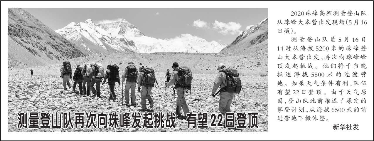
测量登山队再次向珠峰发起挑战 有望22日登顶

而且,公安机关交通管理部门、交通运输主管部门以及高速公路经营管理者不得限定故障车辆、事故车辆当事人到其指定单位修理车辆。