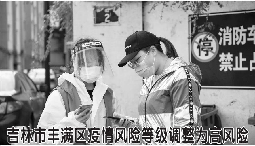
吉林市丰满区疫情风险等级调整为高风险