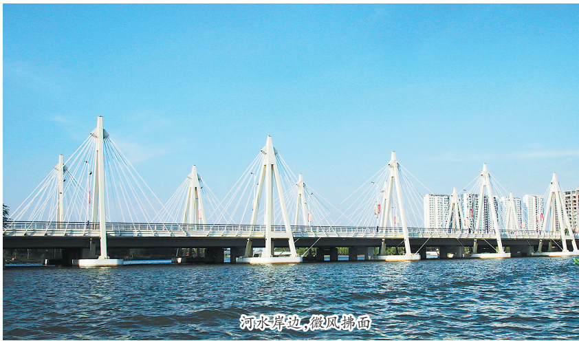
河水岸边,微风拂面