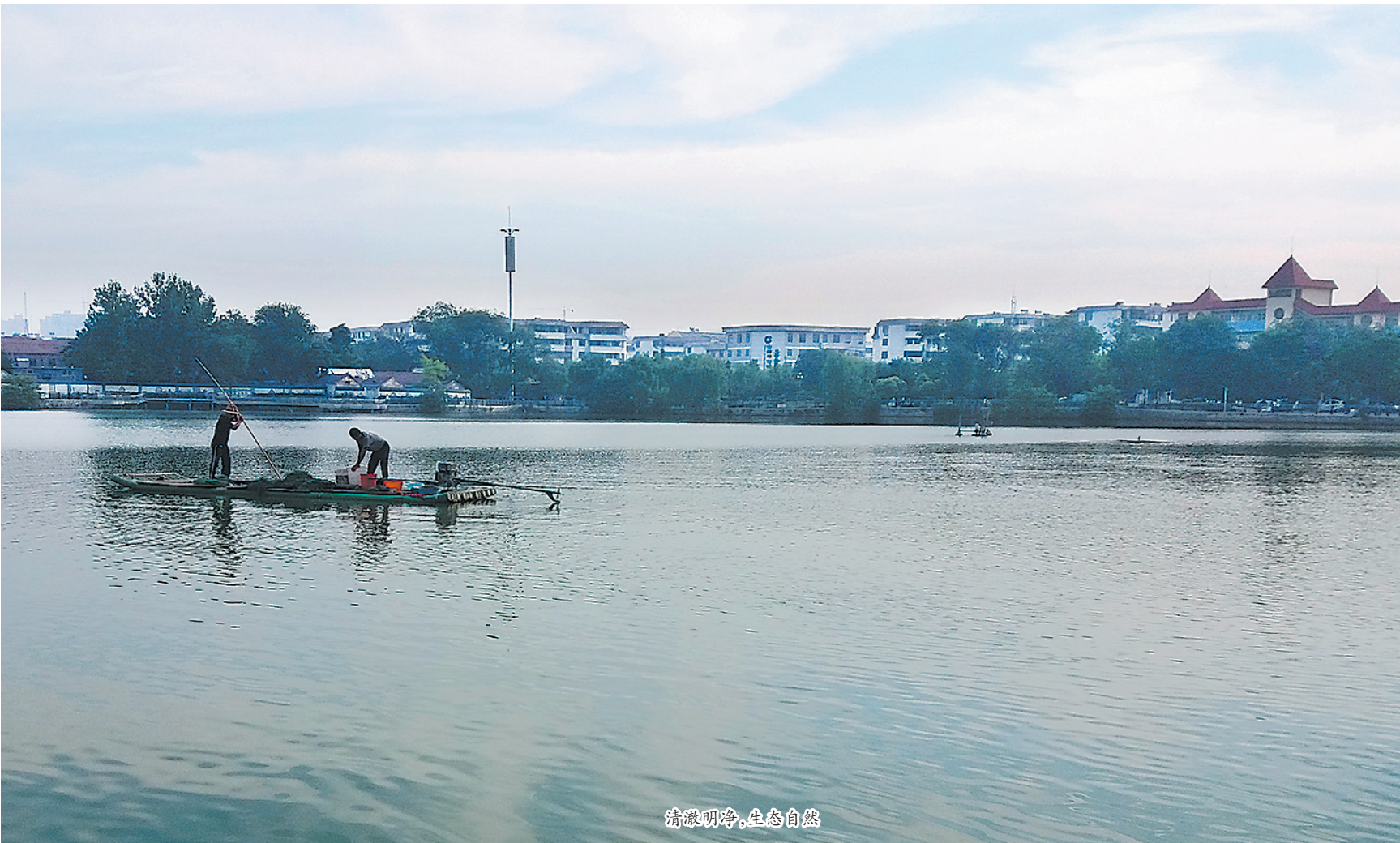
清澈明净,生态自然