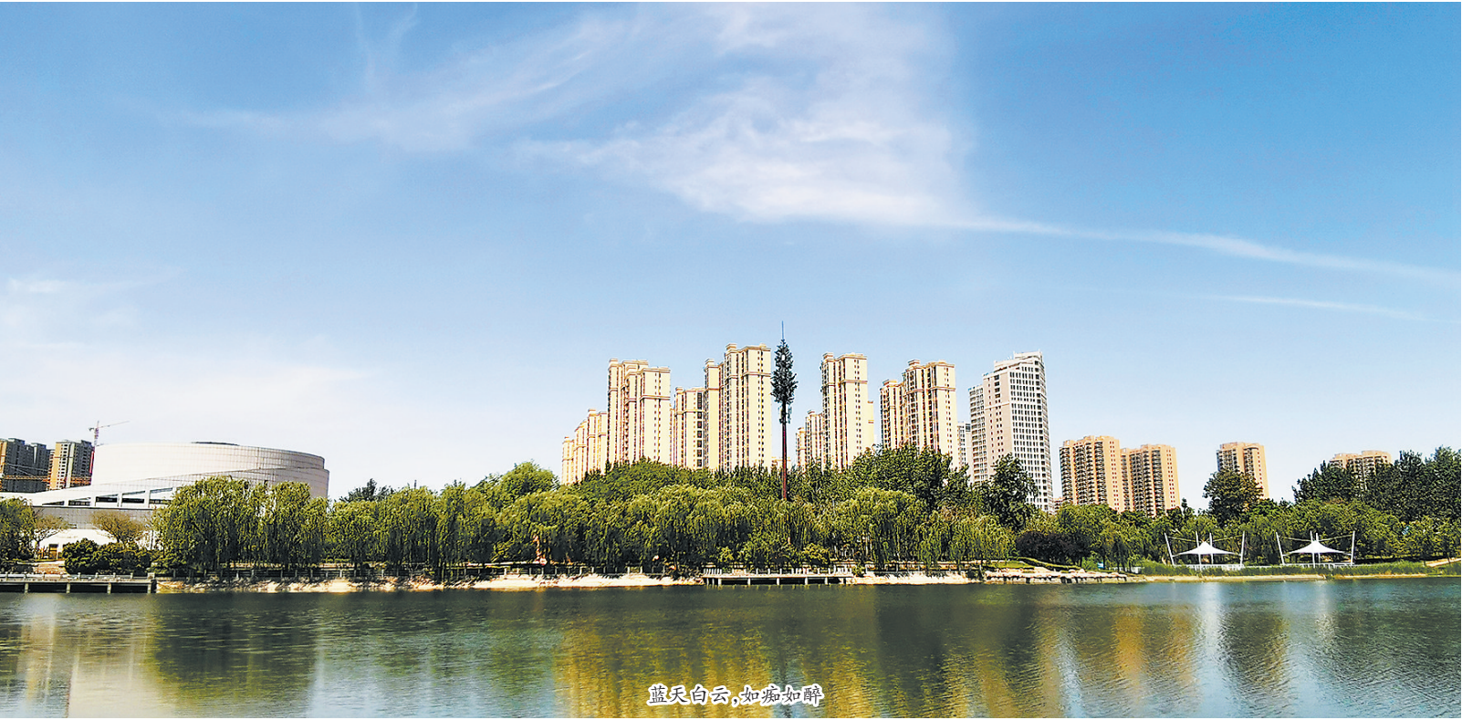
蓝天白云,如痴如醉