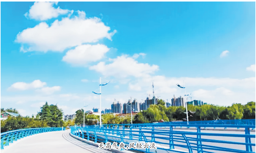
天高气爽,风轻云淡