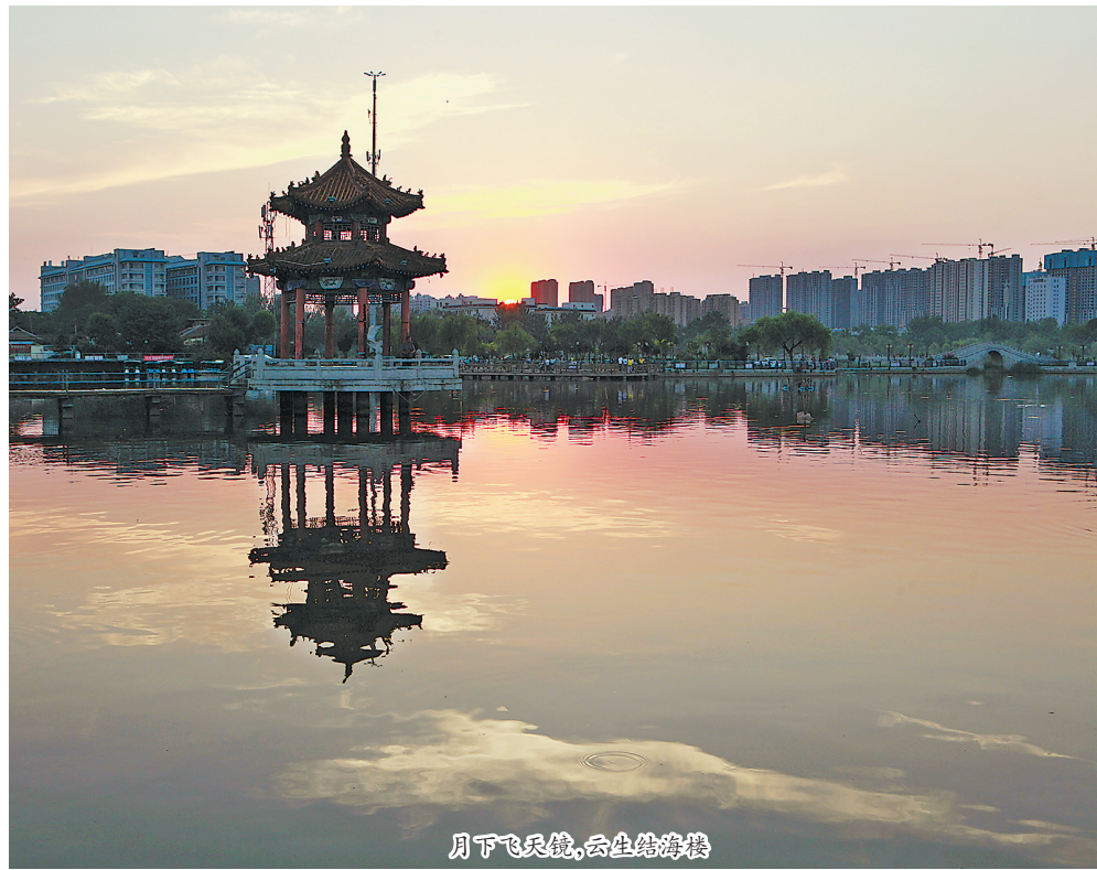
月下飞天镜,云生结海楼