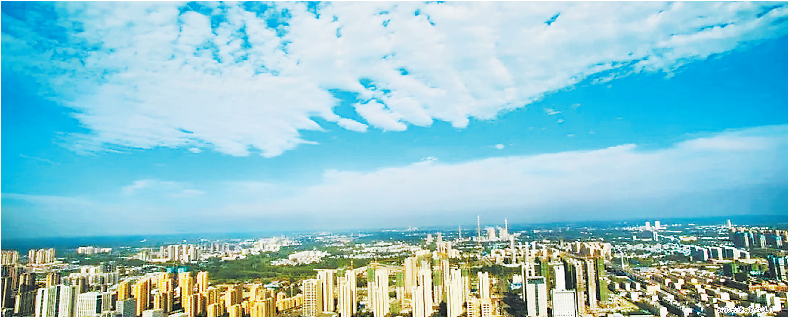
云影云迹,赏心悦目