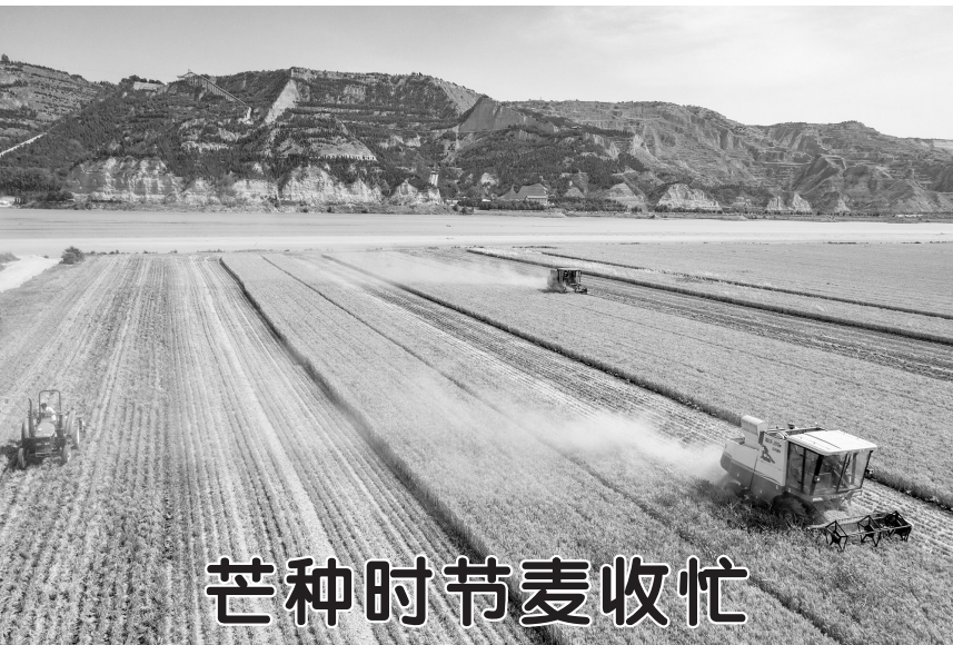
6月5日,在黄河岸边的河南省三门峡市灵宝项生农业机械服务专业合作社的小麦田中,收割机在收获小麦(无人机照片)。 当日是芒种节气,我国各小麦产区的麦收工作正在紧张进行,人们在田间地头忙碌,确保颗粒归仓。

李克强强调,中国正在加紧新冠疫苗、药物、检测试剂科研攻关,重视疫苗研发国际合作,前不久参与了欧盟等方面发起的应对新冠肺炎疫情国际认捐大会,愿继续同各方加强相关合作。全球疫苗免疫联盟同中国一直保持良好合作,曾出资支持中方疫苗接种和国际应用。面对此次新冠肺