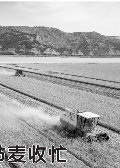
6月5日,在黄河岸边的河南省三门峡市灵宝项生农业机械服务专业合作社的小麦田中,收割机在收获小麦(无人机照片)。 当日是芒种节气,我国各小麦产区的麦收工作正在紧张进行,人们在田间地头忙碌,确保颗粒归仓。

本次会议旨在为全球疫苗免疫联盟筹资,确保疫苗可及性,特别是为加快新冠肺炎疫苗研发、生产和分配提供资金支持。30多国领导人以及联合国、世界卫生组织等国际组织负责人参会。