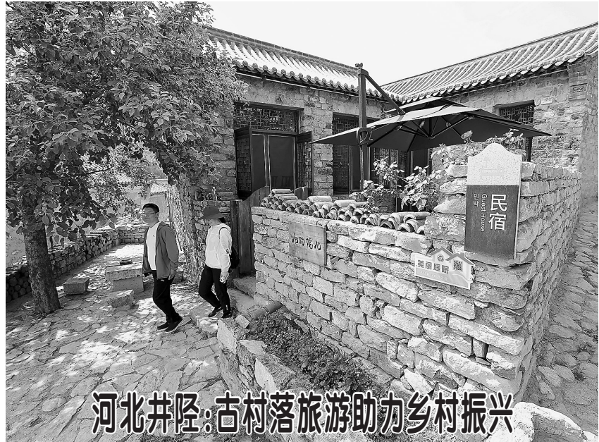
河北井陉：古村落旅游助力乡村振兴