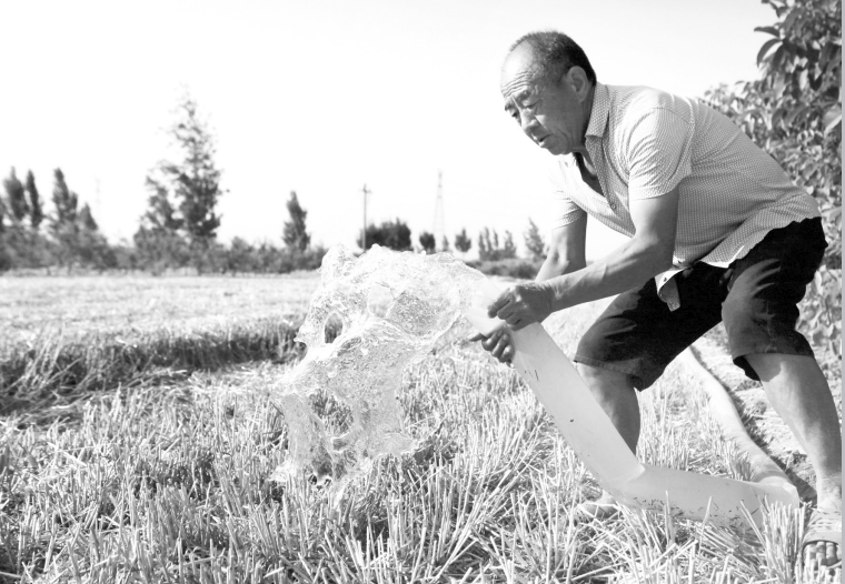
6月11日，在牡丹区何楼街道办事处大片收割之后的麦田里，人们处理麦茬、播种、浇水，一片繁忙景象。眼下夏收已经结束，正值夏作物适播期，麦收之后，广大农民朋友来不及歇息，转入紧张的夏管夏种。