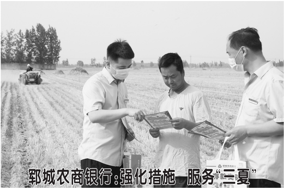
郓城农商银行：强化措施 服务“三夏”

发挥食安办统筹协调作用，指导各地推进食品安全网格化管理体系建设。组织开展农村食品安全宣传和消费警示教育活