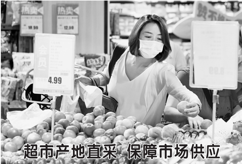
超市产地直采 保障市场供应

动,对全国农贸市场、餐饮等场所及物流等环节集中开展消杀,落实环境卫生等防控制度。 孙春兰指出,由于对新冠病毒变异、传播规律等还没有完全掌握,境外疫情仍在蔓延,常态化下防控任务仍然艰巨繁重,各地区、各部门切不可有任何麻痹思想、厌战情绪、侥幸心理、松劲心态,必须时刻绷紧疫情防控这根弦,强化“四方责任”,落细各项常态化防控措施,慎终始始抓好“外防输入、内防反弹”工作。