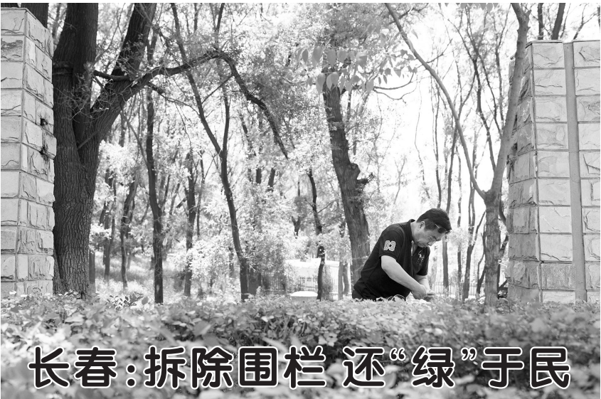
长春：拆除围栏 还“绿”于民