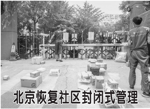
北京恢复社区封闭式管理

“外防输入、内防扩散”，坚持“及时发现、快速处置、精准管控、有效救治”，坚持“三防”“四早”“九严格”……这些措施都是针对实际情况和可能出现的疫情提出来的，落实到位对于防控疫情十分必要。面对北京仍在增长的确诊病例数，各方都