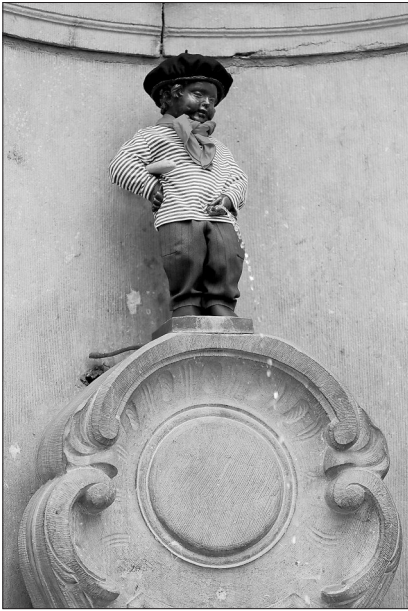
▲这是7月14日在比利时布鲁塞尔拍摄的“小尿童”于连塑像。 当日是法国国庆日,比利时布鲁塞尔的工作人员为“小尿童”于连塑像着装,让其“戴上”贝雷帽,“手持”法棍,以纪念这一节日。

据新华社纽约7月13日电 美国约翰斯·霍普金斯大学13日发布的新冠疫情统计数据显示,截至美国东部时间13日16时34分,全球累计新冠确诊病例达到13006764例,累计死亡病例为570776例。 数据显示,美国是全球疫情最严重的国家,累计确诊病例3346246例,累计死亡病例135477例。巴西累计确诊病例1864681例,累计死亡病例72100例,两项数据均仅次于美国。印度累计确诊病例878254例,俄罗斯累计确诊病例732547例。