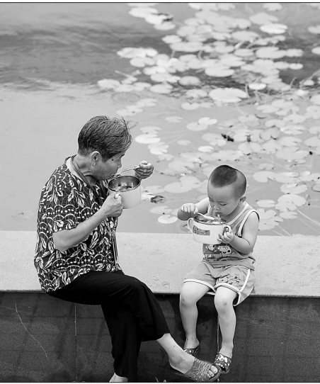
▲7月14日,在宿松县洲头乡中心小学集中安置点,洲头乡泗洲村的村民在吃晚餐。 近日,安徽省宿松县洲头乡泗洲村的300多名村民因洪水被转移至该乡中心小学集中安置点。安置点工作人员、志愿者利用学校食堂为村民们烹饪饭菜,让村民们在安置点吃上热腾腾的三餐。

一是规范合同订立及资金保障,加强账款支付源头治理。《条例》规定,机关、事业单位和大型企业不得要求中小企业接受不合理的付款期限、方式、条件和违约责任等交易条件,不得违约拖欠中小企业的货物、工程、服务款项。同时,强化财政资金保障约束,机关、事业单位使用财政资金从中小企业采购货物、工程、服务,应当严格