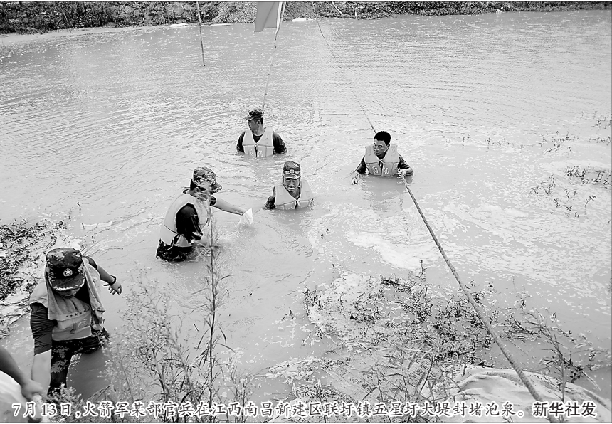
新华社南昌7月13日电（记者 吴镭昊 闵涛涛）7月13日23时8分,随着操作手驾驶推土机将最后一车土石倒入决口处,江西省鄱阳县问桂道圩决口封堵现场响起一片欢呼声。在抢险人员连续奋战83小时后,127米宽的决口成功合龙。 7月3日以来,鄱阳县出现持续强降雨,昌江流域水位迅速上涨,多个站点连续超警。8日20时35分,鄱阳镇问桂道圩堤发生漫决,堤内1.5万亩耕地和6个村庄被淹,近万名群众被紧急转移。 险情发生后,中国安能第二工程局迅速从江西南昌、江苏常州、福建厦门调集400余名抢险人员、52台套装备星夜驰援,并与陆续赶来增援的火箭军、武警和预备役部队,一同封堵决口。他们结合水情灾情、道路交通、灾区地形、未来气候及可能发生的次生灾害等因素,集中研判灾情,制

新华社北京7月14日电（记者 于文静）农业农村部14日启动农业重大自然灾害二级应急响应,向江苏、安徽、江西、湖北、湖南等5个省派出抗洪救灾专家工作组,深入重灾区调查了解灾情、评估影响,会同地方农业农村部门完善防汛救灾和灾后生产恢复技术方案。 这是记者14日从农业农村部了解到的消息。 据了解,6月以来,我国南方出现持续强降雨,累计雨量大,覆盖范围广,长江中下游地区发生较重洪涝灾情,给农业生产带来一定影响。