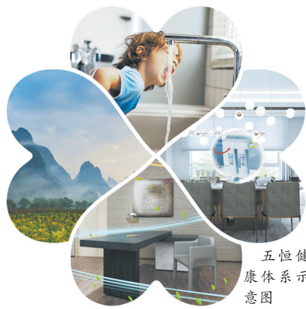
五恒健康体系示意图

体验鉴真知,对于健康生活如何定义,天安夏威夷全城招募五恒健康首席体验官,让市民实地入住、切身感受引领健康人居的舒适体验,“全民试住”活动将于8月1日正式启动。一场试住之旅,一次健康生活的真实体验,天安夏威夷以健康出发,为每一位“体验官”带来舒适、健康的生活感受,让每一位“体验官”通过切身经历,发现更多美好健康生活的秘密。