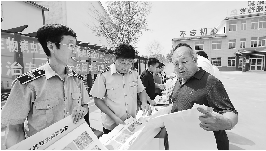
▲7月23日，在曹县韩集镇，市农业农村局技术人员向村民介绍农作物病虫害防治和植物检疫的有关知识。据了解，为进一步贯彻落实《农作物病虫害防治条例》，做好植物检疫宣传和草地贪夜蛾等重大病虫害监测防控工作，市农业农村局技术人员举办本次农作物病虫害防治条例和植物检疫宣传月活动。通过发放宣传资料、张贴宣传画报、口头解答群众问题等方式，让老百姓能够迅速了解《农作物病虫害防治条例》的相关内容以及植物检疫有关知识，提升病虫害防治能力，确保实现粮食安全生产目标。