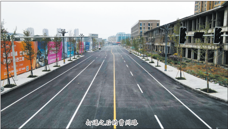
打通之后的曹州路