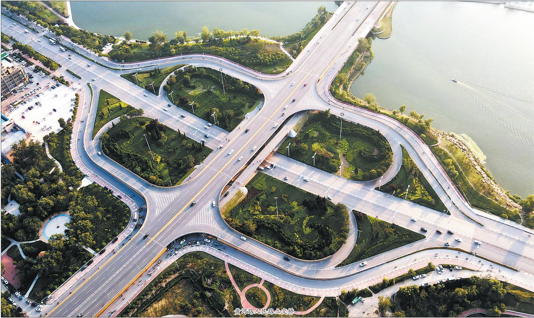
黄河路人民路立交桥