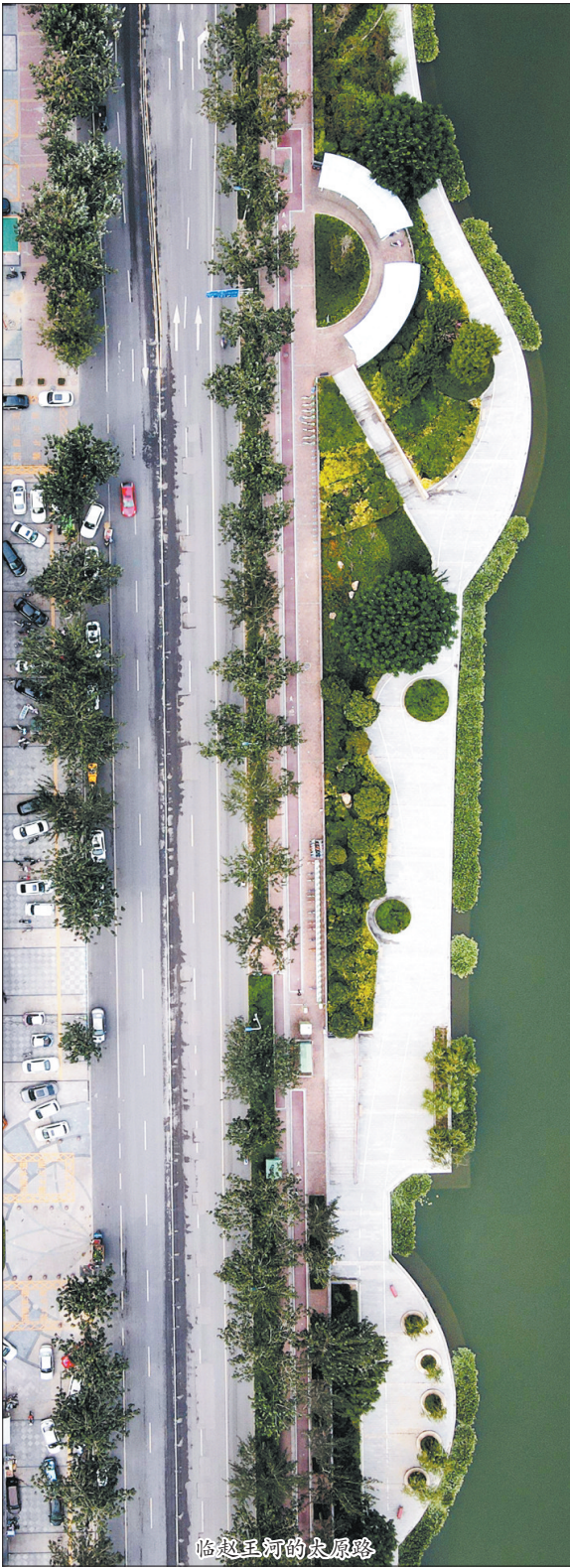
临赵王河的皮肤路