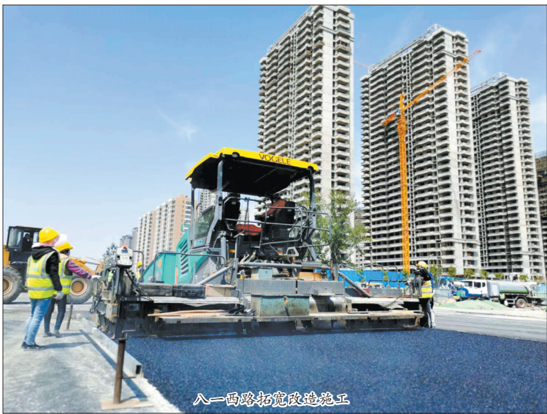
八一西路拓宽改造施工