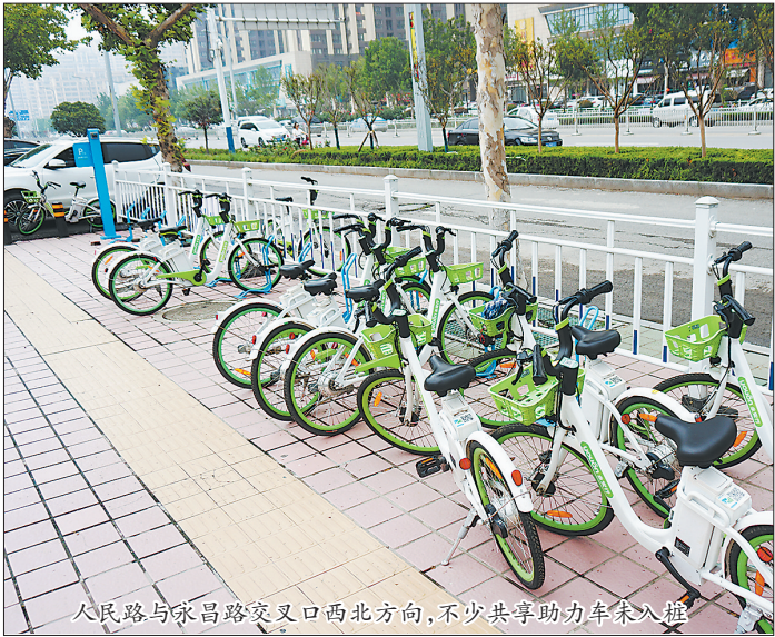
人民路与永昌路交叉西北方向，不少共享助力车未入桩