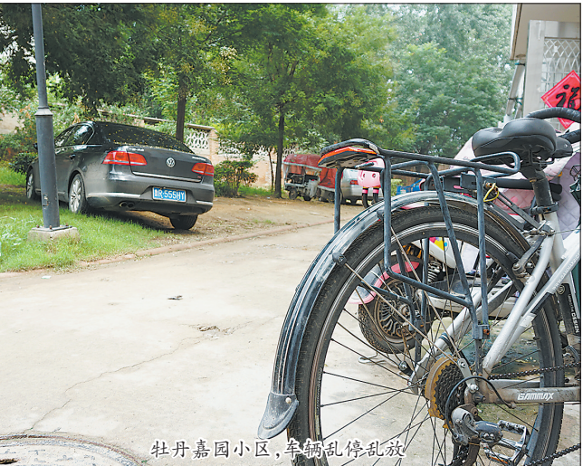
牡丹嘉园小区，车辆乱停乱放