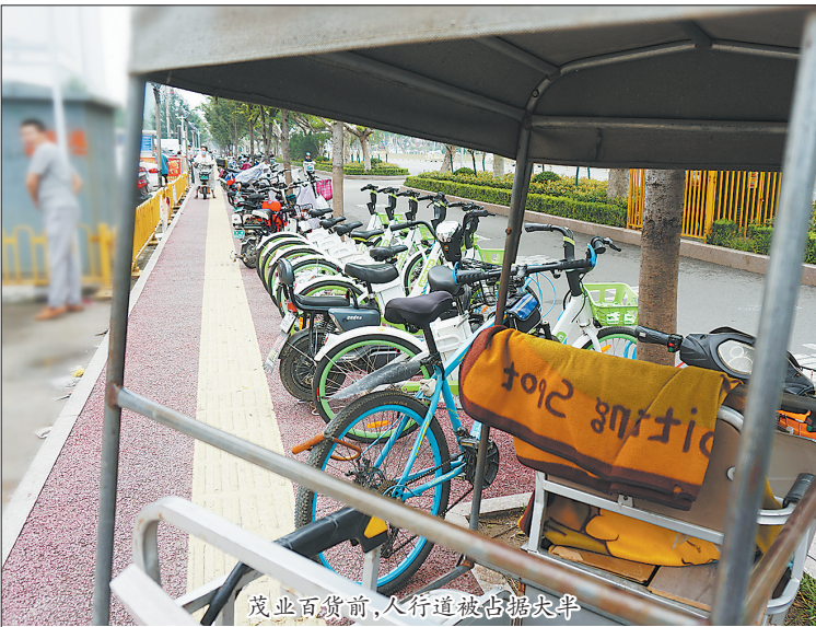
茂业百货前，人行道被占据大半