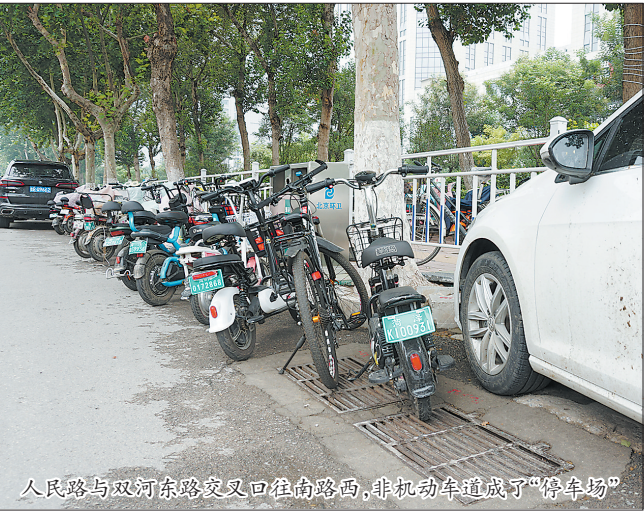
人民路与双河东路交叉口往南路西，非机动车道成了“停车场”

新苏天美、佳和购物广场等大型商超以及桔子酒店、圣豪海鲜宫等大型餐饮酒店前，均存在不同程度占用非机动车道、人行道的现象。除此之外，临街商铺门前也成了违规停车的重灾区。 在帝都花园西面、北面、南面，人行道成了机动车停车场，几乎看不到盲道的“模样”；商铺门前非机动车横七竖八、随意停放，既妨碍正常通行，也影响市容市貌。 共享助力车本为方便市民出行，但是却存在不少未停进车桩的现象，路旁、人行道上，甚至就在车桩附近，散落着一辆辆不能回“家”的共享助力车，成了影响市容市貌的一个“减分项”。 不仅街道上，居民小区内违规停车现象也较为常见，甚至有些人把车停在消防通道上。在牡