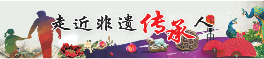
文/图 记者 时苏建