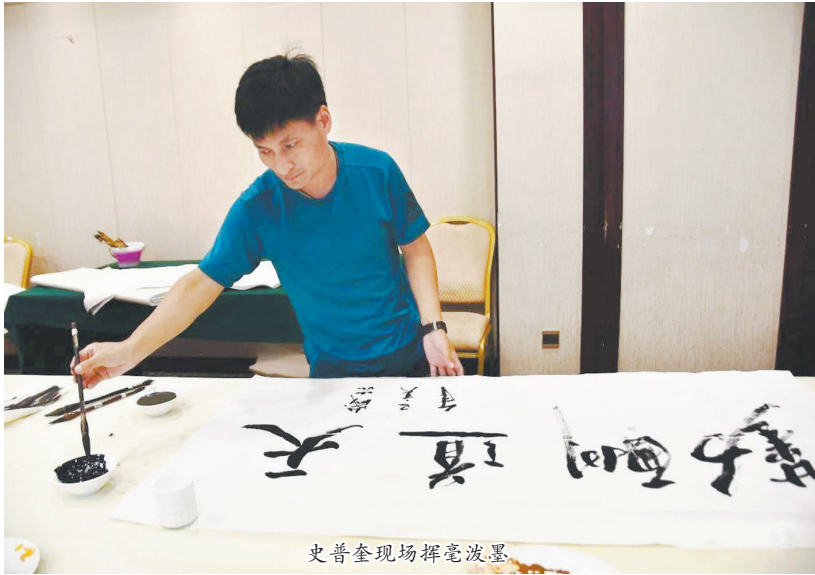
史普奎现场挥毫泼墨