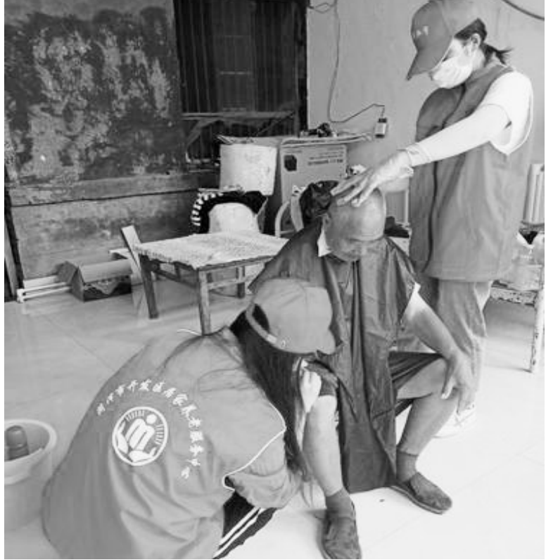
▲日前，市开发区特困分散供养社会化服务启动。居家养老服务中心的工作人员根据照料护理需求，上门为分散供养特困人员提供生活照料、家政服务、康复护理、精神慰藉、紧急救助和安全预警等方面的照料护理服务。“菜单式”的规范化照料服务，确保了分散供养特困人员“安全有人关注、平日有人照应、生病有人看护”。图为工作人员为老人理发、剪指甲。