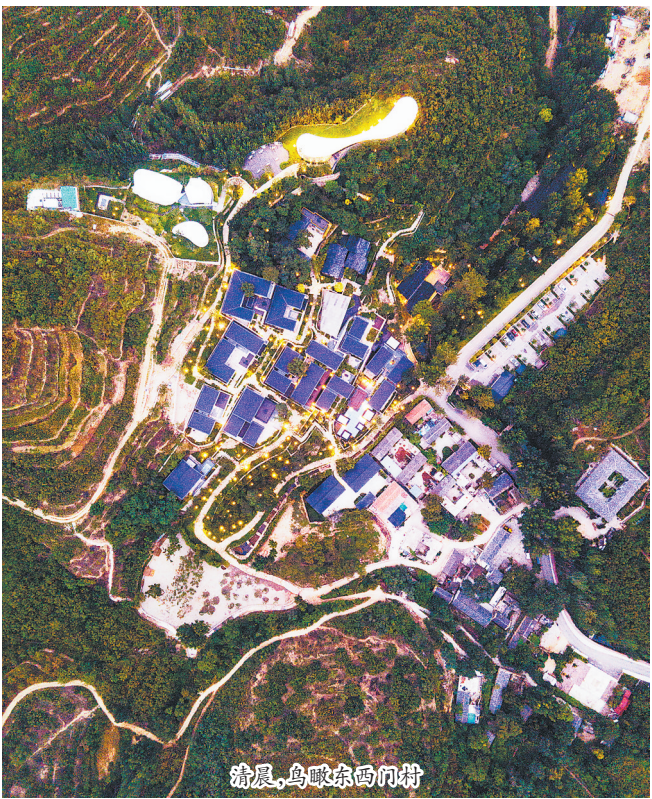
清晨，鸟瞰东西门村