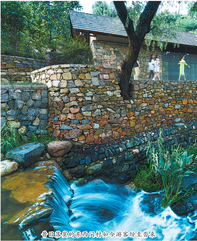
昔日落寞的东西门村如今游客纷至沓来