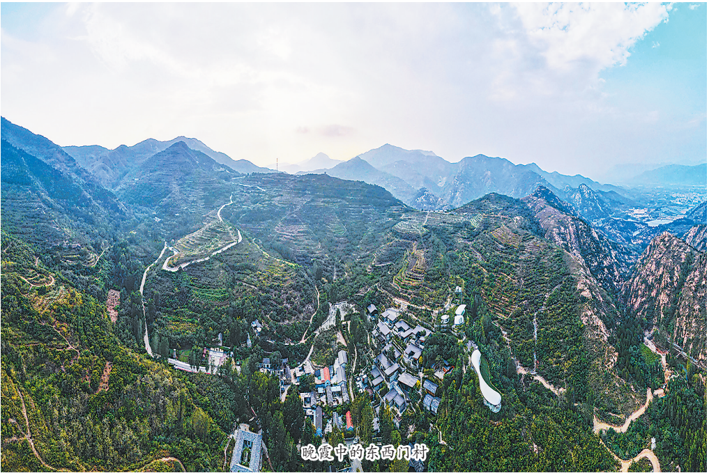
晚霞中的东西门村