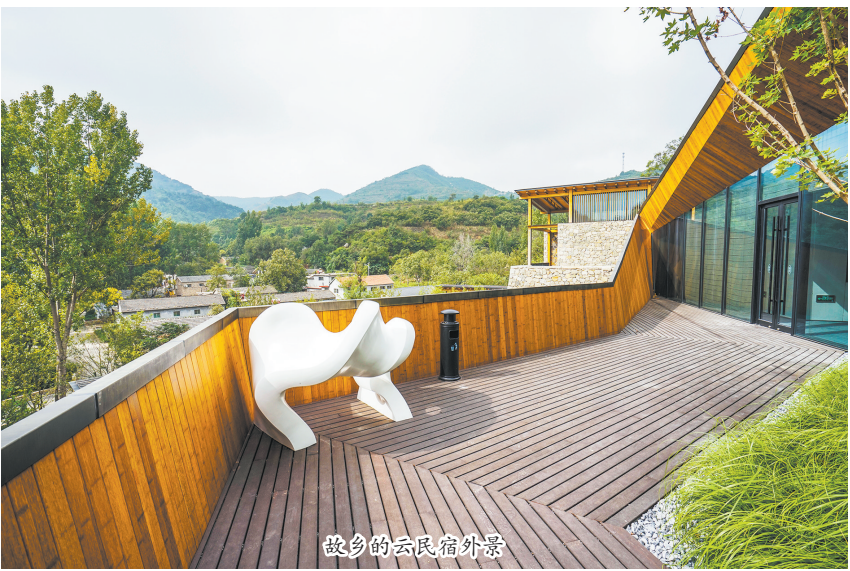
故乡的云民宿外景