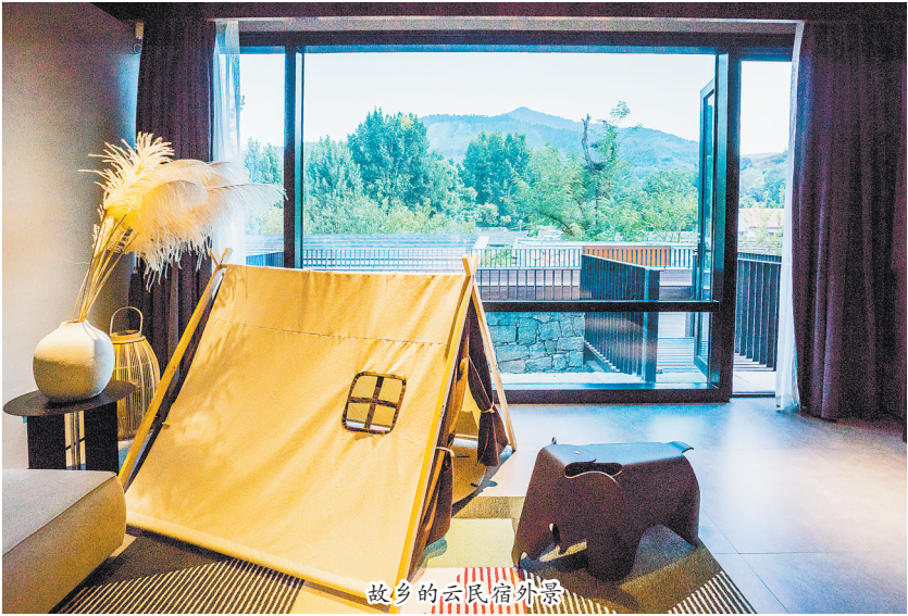
故乡的云民宿外景