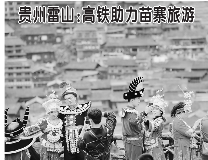
▲10月7日,游客穿着民族服装在贵州省雷山县西江千户苗寨观景台拍照留念。

西江千户苗寨、郎德苗寨位于贵州省黔东南苗族侗族自治州雷山县,距离沪昆高铁凯里南站均不到50公里的路程。近年来,当地不断推动高铁资源和旅游景区深度融合,方便各地游客前来体验苗族风情,观赏苗寨美景,为古老苗寨的乡村振兴注入活力。