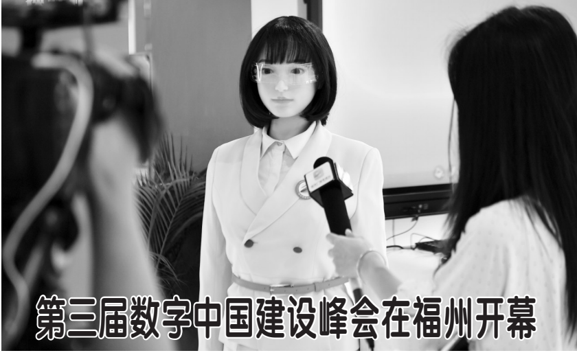
第三届数字中国建设峰会在福州开幕

出现患病症状前,被病毒感染者就可能已经具备传染性。患者感觉身体恢复也并不意味着其身边人群就安全了。一些患者在症状消失后仍具有传染性,可将携带的病毒或细菌传播给他人。 关于新冠患者康复后的免疫力,世界卫生组织专家玛丽亚·范克尔克霍夫曾表示,患者免疫系统确实会启动以应对新冠病毒,但尚不完全清楚这种免疫反应有多强烈以及能持续多久。