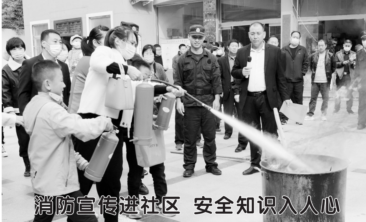
11月1日，在牡丹区西城办事处文心花园小区，社区居民在消防人员的指导下进行灭火演练。为迎接“11·9”消防宣传日，提升市民消防安全意识，菏泽天海物业联合牡丹区住建、消防大队、西城办事处等部门走进社区，在小区内开展消防宣传活动，并进行疏散逃生和灭火器材操作演练。为了提高广大业主的积极性，物业部门对已讲解的消防常识等进行了现场有奖问答，广大业主踊跃参与，取得了良好的宣传效果。现场业主纷纷表示，在活动中提高了消防安全意识。

王英龙表示，科技工作的首要前提是自主创新，要从根本上解决“卡脖子”难题。他建议，菏泽市科技产业发展要依托省级政策，构建公共开放科技云平台，聚合