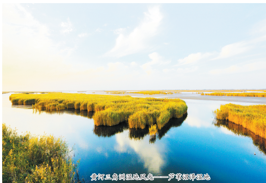
黄河三角洲湿地风光——芦苇沼泽湿地