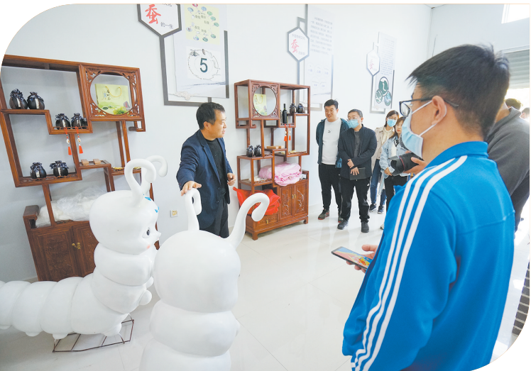
记者在乡村振兴新样板——龙居镇林家村采访