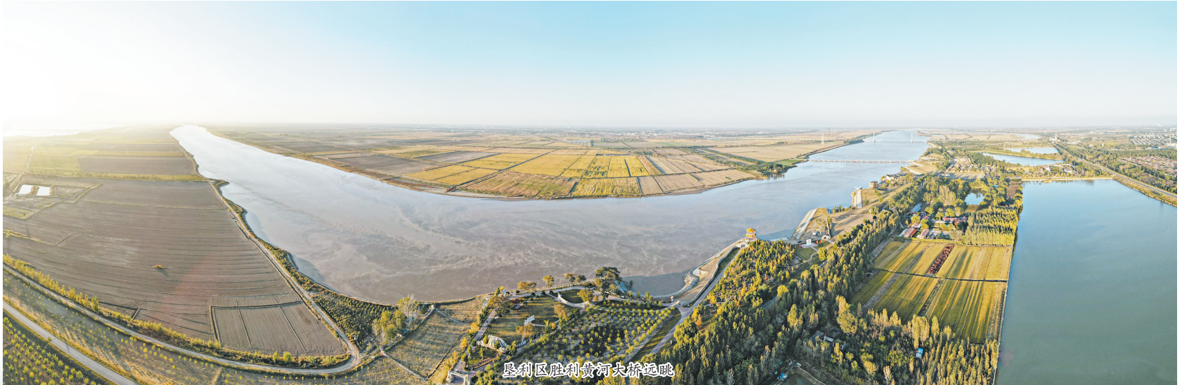
垦利区胜利黄河大桥远眺