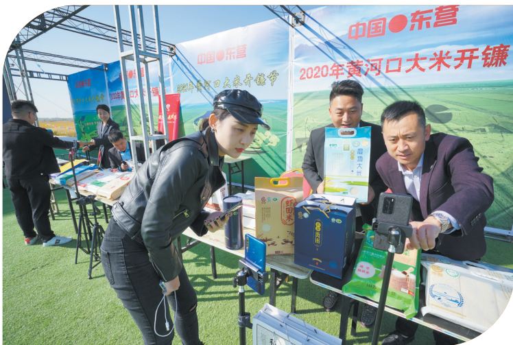
优质的黄河口大米成了网上的抢手货