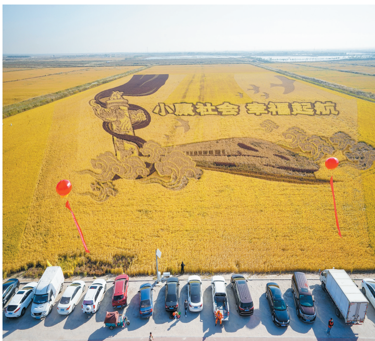
永安镇万亩生态水稻喜获丰收