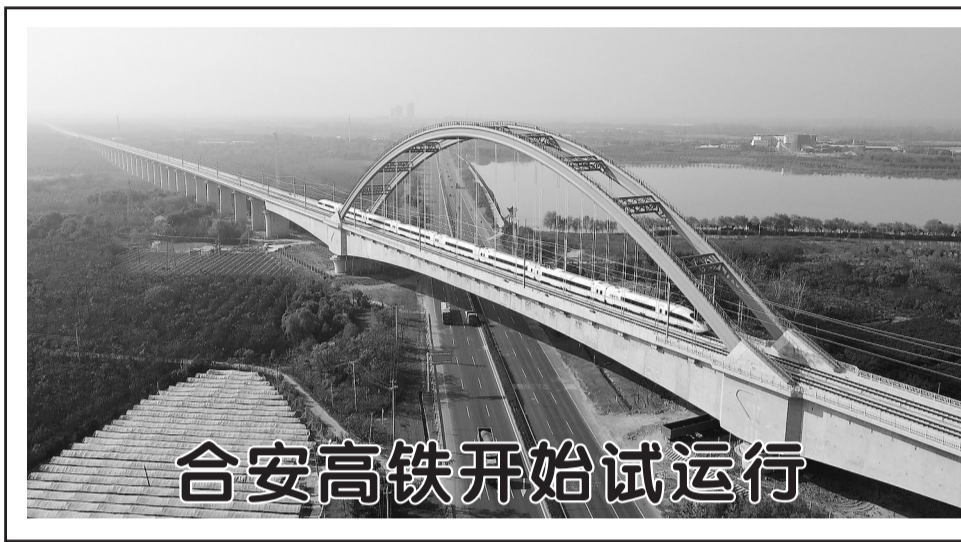
合安高铁开始试运行