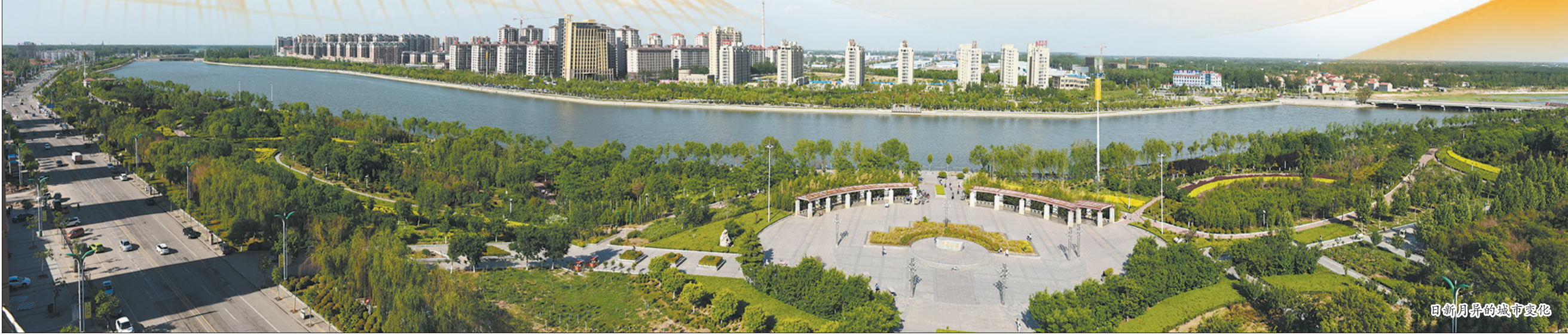
日新月异的城市变化