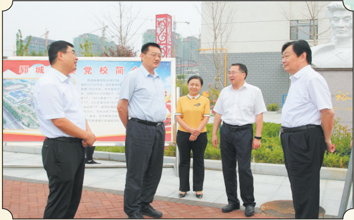
市委书记张新文在郓城县委书记刘文林、县长谷永强陪同下调研工作

积极推进人口市民化。大力实施户籍管理制度改革、供销社综合改革、农村集体产权制度改革,将国家级新型