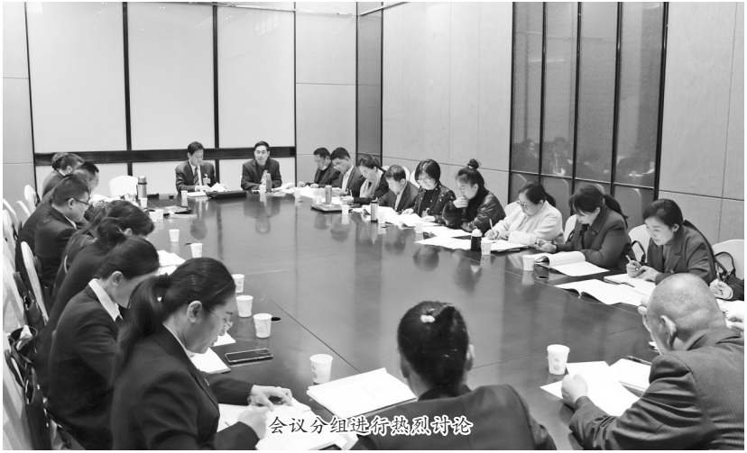
会议分组进行热烈讨论