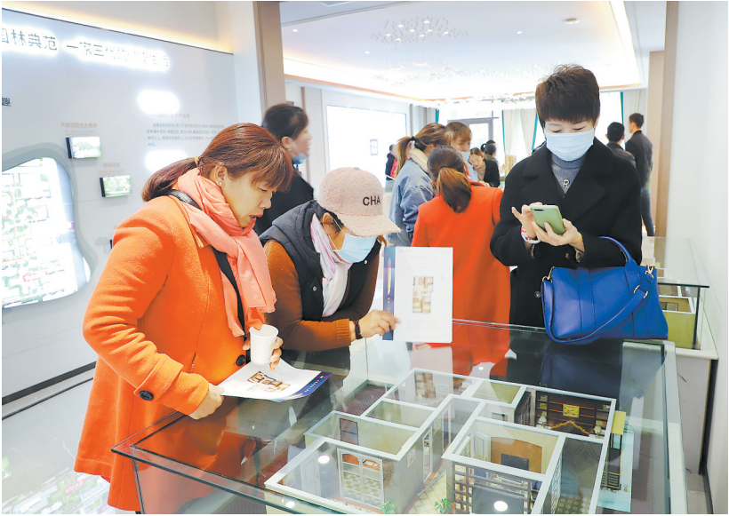
到场客户了解户型设计

本报讯(记者 李亚楠)11月14日,2020“亿联新康庄”杯少儿才艺大赛启动仪式暨预选赛在亿联新康庄服装城拉开帷幕。此次大赛旨在帮助少年儿童确立积极的奋斗目标,培养和提高少年儿童敢于展现的精神,由菏泽市舞蹈家协会、菏泽市曲艺家协会作为指导,亿联世贸中心、亿联新康庄服装城共同主办,大赛分为预选赛、半决赛、决赛,将历时一个半月。