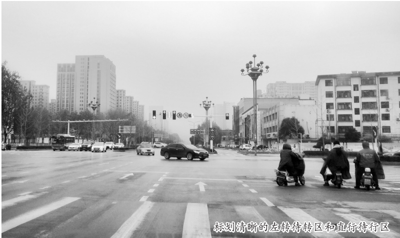
标划清晰的左转待转区和直行待行区

“已经可以到待行区待行,前面的车就是不动,按喇叭也白搭。”最近一段时间,我市不少车主抱怨,设置待行区、待转区就是为了提高车辆通过率,但是许多司机根本就不使用,让人费解。