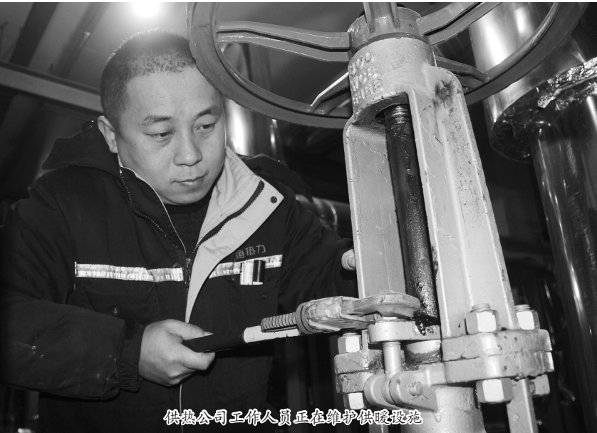
供热公司工作人员正在维护供暖设施 少呼吸道疾病的发生。阳光是最健康的暖护,如遇阳光晴好的日子,最好收起窗帘、打开窗户,让阳光直接照射进屋子,不仅可使室内空气保持新鲜流通,还能升高室内的温度。

室内应定时通风,冬天人们为了保证室温,往往紧闭门窗,温度虽然高了,但是室内空气中的细菌病毒等无法清除。因此,每天天气晴好的时候应开窗换气,使室内空气焕然一新,同时清扫室内卫生垃圾,可以减