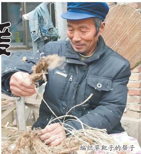
编织草靴子的帮子