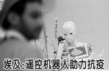
埃及:遥控机器人助力抗疫

新华社曼谷12月7日电 泰国内政部防灾减灾厅7日说,南部多府连日来强降雨导致洪涝灾害,目前已造成24人死亡。 根据防灾减灾厅7日发布的消息,自11月25日以来,泰国湾一带及南部地区受东北季风和低压气流影响出现连日强降雨,导致超过55.5万栋房屋被淹,其中洛坤府受灾最严重,共有19人死亡,18万栋房屋被淹。