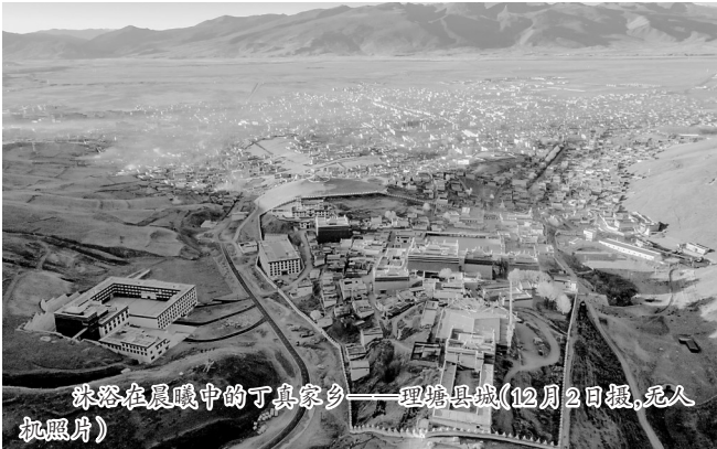
珠路在展眼中的丁真家乡——理塘县城(12月2日摄,无人机照片)