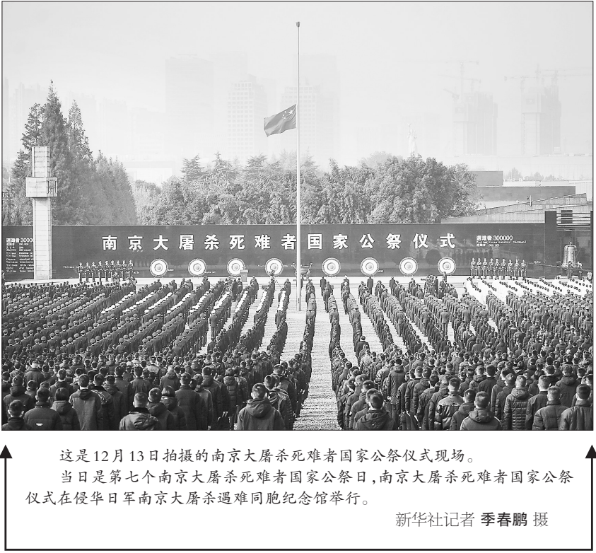
这是12月13日拍摄的南京大屠杀死难者国家公祭仪式现场。当日是第七个南京大屠杀死难者国家公祭日,南京大屠杀死难者国家公祭仪式在侵华日军南京大屠杀遇难同胞纪念馆举行。

中共中央、国务院在南京举行2020年南京大屠杀死难者国家公祭仪式 据新华社南京12月13日电 中共中央、国务院13日上午在南京隆重举行2020年南京大屠杀死难者国家公祭仪式。中共中央政治局委员、中组部部长陈希出席并讲话。 公祭仪式在侵华日军南京大屠杀遇难同胞纪念馆集会广场举行。现场国旗下半旗。3000余名各界代表胸前佩戴白花,默然肃立。10时整,公祭仪式开始,奏唱《中华人民共和国国歌》。国歌唱毕,全场向南京大屠杀死难者默哀,南京市全城拉响防空警报,汽车停驶鸣笛,行人就地默哀。默哀毕,在解放军军乐团演奏的《国家公祭献曲》的旋律中,解放军仪仗大队16名礼兵将8个花圈敬献于公祭台上。 之后,陈希发表讲话。他表示,今天,我们在这里隆重集会,深切缅怀南京大屠杀无辜死难者,缅怀所有惨遭日本侵略者杀戮的死难同胞,缅怀为中国人民抗日战 争胜利献出生命的革命先烈和民族英雄,缅怀同中国人民携手抗击日本侵略者献出生命的国际战士和国际友人,宣示中国人民铭记历史、不忘过去,珍爱和平、开创未来的庄严立场,表达坚定不移走和平发展道路的崇高愿望。 陈希指出,历史的苦难不能忘记,前进的脚步永不停息。在中国共产党的坚强领导下,今日的中国,比历史上任何时期都更接近实现中华民族伟大复兴的宏伟目标,困扰中华民族几千年的绝对贫困问题历史性得到解决,全面建成小康社会胜利在望,全面建设社会主义现代化国家新