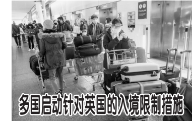
多国启动针对英国的入境限制措施

据克里姆林宫网站21日发表的声明，普京当天在出席俄国防部扩大部务会议时指出，截至12月中旬，现代武器在俄军队中占比已超过70%，在俄核威慑力量中占比已达86%。俄军队以及“三位一体”核力量已达到可以保障本国安全的水平。