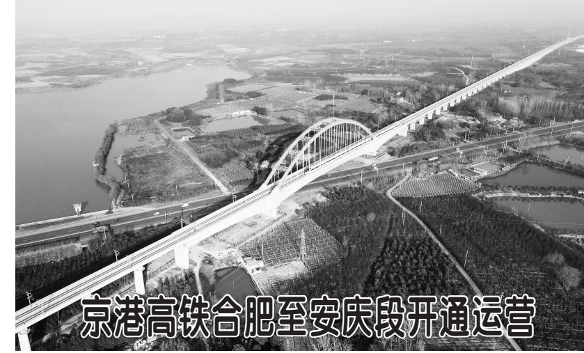
一列高铁列车经过安徽西花岗特大桥（12月22日摄，无人机照片）。

当日，京港高速铁路合肥至安庆段开通运营。京港高铁合肥至安庆段是我国“八纵八横”高速铁路网京港（台）通道的重要组成部分，北端通过合肥枢纽连接商合杭高铁、合宁高铁、合福高铁等，南端在安庆与宁安高铁、建设中的京港高铁安庆至九江段连通。线路全长176公里，设计时速350公里，共设合肥南、肥西、舒城东、庐江西、桐城东、桐城南、安庆7座车站。