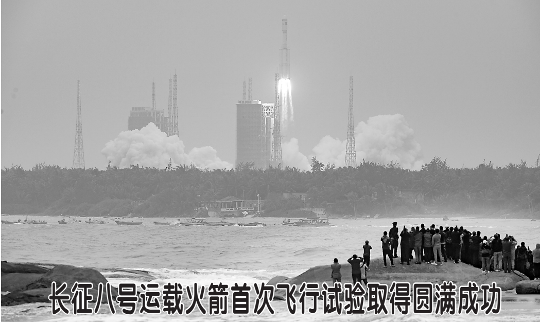
长征八号运载火箭首次飞行试验取得圆满成功

经济运行逐步恢复正常，但对小微企业生产经营面临的特殊困难仍需加以帮扶。为贯彻落实中央经济工作会议精神，努力保持经济运行在合理区间，要保持政策连续性、稳定性和可持续性，做好政策接续和合理调整，激发市场主体活力，稳定市场预期。会议确定，一是明年一季度要继续落实好原定的普惠小微企业贷款延期还本付息政策，在此基础上适当延长政策期限，做到按市场化原则应延尽延，由银行和企业自主协商确定。对办理贷款延期还本付息且期限不少于6个月的地方法人银行，继续按贷款本金1%给予激励。二是将普惠小微企业信用贷款支持计划实施期限由今年底适当延长。对符合条件的地方法人银行发放普惠小微企业信用贷款，继续按贷款本