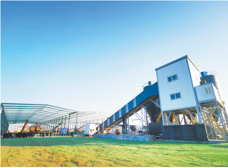
►今朝高新环保建材项目 ▼达纳散热器生产车间(资料片)