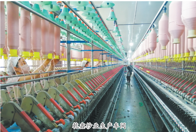
冠宇食品生产车间