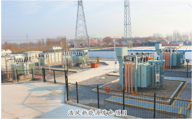
浩风新能源发电项目