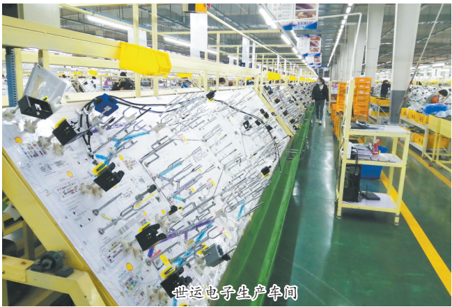
世运电子生产车间