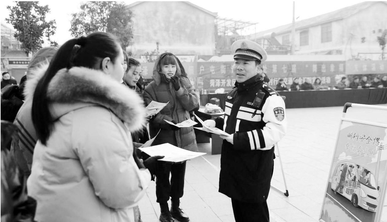
为大力提升农村群众交通安全意识,进一步增强群众出行的安全感、幸福感和获得感,12月26日,市开发区交警大队走进辖区龙山社区开展“美丽乡村行”交通安全宣传活动,并联合佃户屯街道办事处为当地居民奉献了一场精彩纷呈的“文艺大餐”。活动中,宣传民警与村民一起观看“广场舞表演”,交通安全宣传与独具特色的广场舞表演融合在一起,让群众娱乐的同时,也接受了交通安全教育。据介绍,交通安全宣传进农村活动共发放宣传资料320余份。