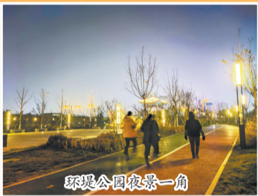
環堤公園夜景一角

据了解,環堤公園全線亮化工程分為創意運動段、牡丹文化段、生態體驗段、文脈傳承段四部分,目前,環堤公園項目主體亮化工程已全部完成,新增加的2處仿古廊橋的亮化工程正在施工中,計劃春節前完成。