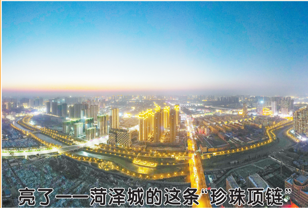
亮了一——荷澤城的這條“珍珠項鏈”

居用品、眾然木業、迈格新材料、盛暉木業、福林熱力等重點企業和項目,圍繞市場行情、企業管理、前景規劃與企業負責人詳細交流,鼓勵他們堅定信心,瞄準市場走高質量發展路子。張新文指出,莊寨鎮作為曹縣副中心城市,要繼續發揚敢想、敢干、敢試的奮鬥精神,打破等、靠、要思想,不斷提高民營經濟發展水平。要強化規劃引領,抓好優勢產業培育和園區建設,全力推動重點鎮高質量發展。