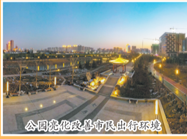
公園亮化改善市民出行環境