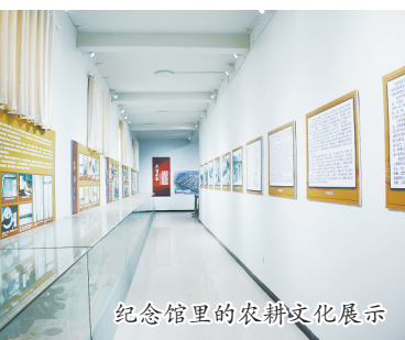
纪念馆里的农耕文化展示

为更好地保护民俗文化遗产,发扬前辈的优良传统和艰苦奋斗、自力更生精神,展现他们的聪明才智,教育子孙后代饮水思源,小井镇党委、政府决定建设小井乡村记忆馆,通过收集和展示民俗文化遗产,再现小井民俗文化、传承当地文明,并使之成为爱国主义教育基地。