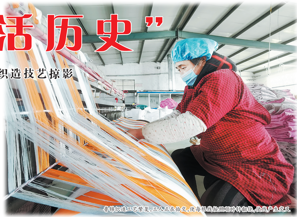
鲁锦织造工艺复杂,工人正在捻花,使每根线按照顺时针方向旋转,使线产生交叉