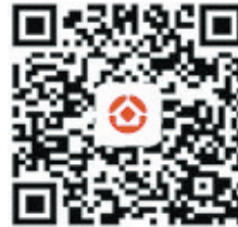
菏泽市住房公积金手机app