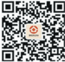
菏泽市住房公积金微信公众号

据了解,住房公积金网上业务主要是通过缴存人线上提交办事材料,中心业务人员人工审核的方式进行办理,不仅大大节省了群众的等待时间,而且在提取业务办理方面,离退休提取等可实现系统自动审核,业务即时办结。下一步,市住房公积金管理中心将进一步优化线上服务环境,精简办事材料,优化服务流程,为广大市民缴存职工提供更优质的服务。