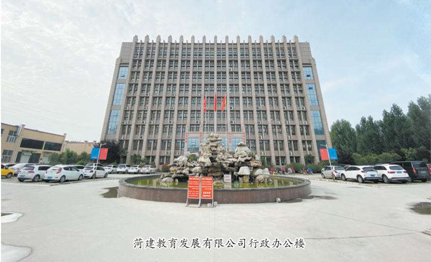
荷建教育发展有限公司行政办公楼

一个国家的经济社会发展离不开人才,在人才培养的“蓄水池”中,职业教育起着至关重要的作用。