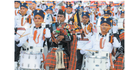
▲这是2月4日在斯里兰卡科伦坡拍摄的阅兵式现场。 斯里兰卡4日在首都科伦坡的独立广场举行阅兵式,庆祝独立73周年。

新华社乌克兰巴托2月4日电 蒙古国国家紧急情况委员会3日宣布,首都乌克兰巴托将从11日6时至23日6时再次实施全民警戒状态,以遏制新冠肺炎疫情持续蔓延。 蒙古国副总理、国家紧急情况委员会主席阿玛尔赛汗当天在新闻发布会上说,根据以往经验,传统佳节“白月节”期间人员流动会激增,疫情蔓延风险陡升,国家紧急情况委员会不得不做出在首都地区实施全民警戒状态的决定。