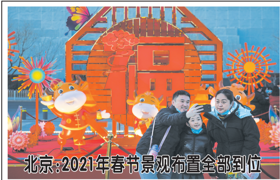
北京:2021年春节景观布置全部到位

当世,更是展望未来。只要“破冰者”精神代代传承,推动友谊与发展的初心不变,就没有打不破的坚冰、消除不了的隔阂。 李克强指出,过去的2020年,对中国、英国和整个世界都是极不平凡的一年。中国经过艰苦努力,全年经济实现2.3%的增长,这是来之不易的。当前新冠肺炎疫情带来的挑战仍然严峻,世界经济还面临许多不