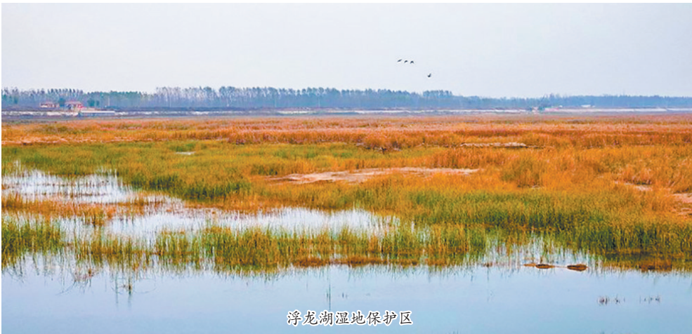
浮龙湖湿地保护区