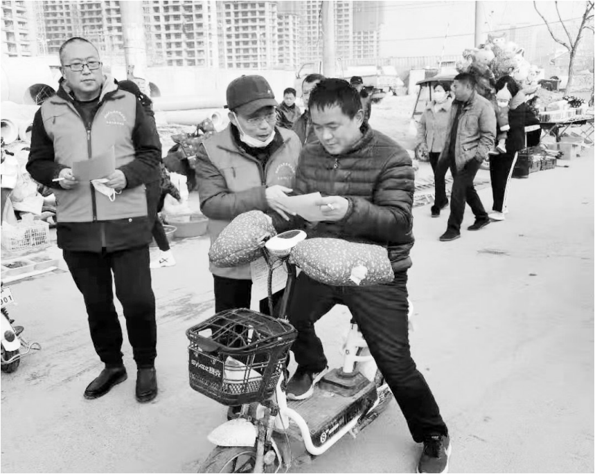
春节期间，曹县公路管理局志愿者结合自身职能，组织开展了一系列志愿服务关爱行动。志愿者在两处在建工程项目部设立志愿服务站，通过发放疫情防控宣传页，引导人民群众加强自我防护，倡树科学文明理念和健康向上的生活方式。同时还到“双报到”社区清理小广告，整理领例共享单车等。

记者了解到，安全生产隐患大排查大整治工作开展以来，该县共检查各类生产经营单位2019家，复查1414家，责令停业整顿10家。发现问题和隐患3402项，已督促完成整改2469项，督促整改完成72.6%，其余933项问题和隐患正在积极整改中。