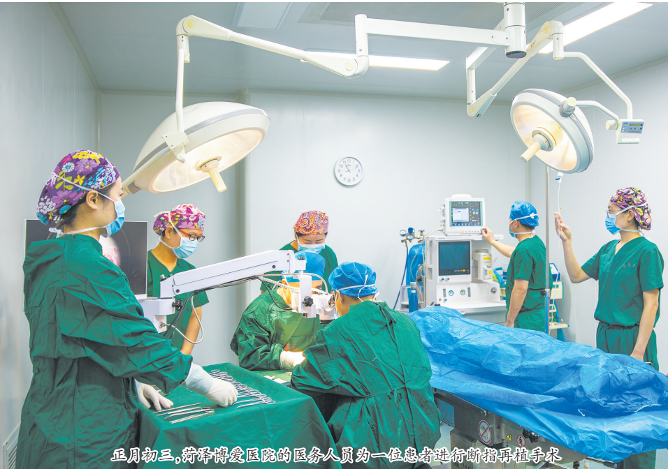
正月初三,菏泽博爱医院的医务人员为一位患者进行断指再植手术