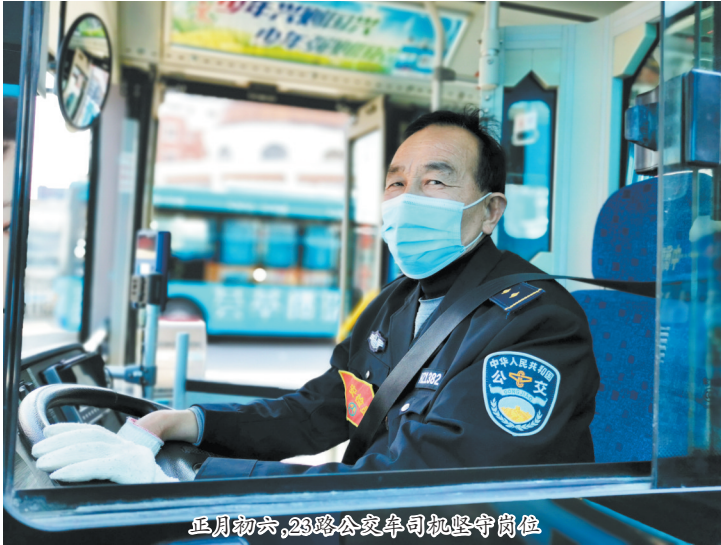
正月初六,23路公交车司机坚守岗位