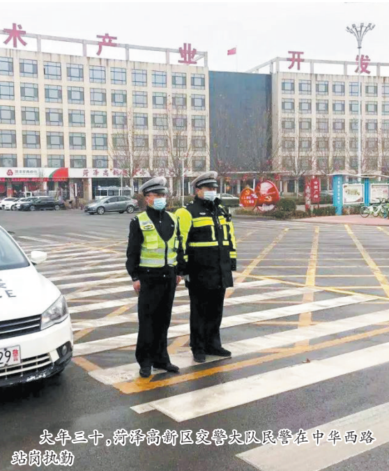
大年三十,菏泽高新区交警大队民警在中华西路站岗执勤