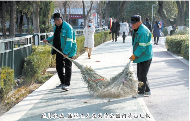
正月初五,园林工人在天香公园内清扫垃圾