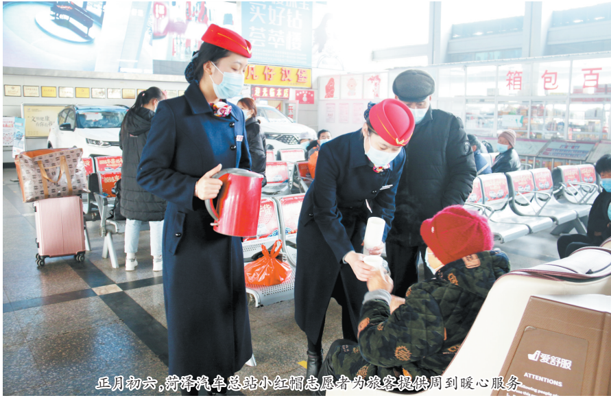
正月初六,菏泽汽车总站小红帽志愿者为旅客提供周到暖心服务