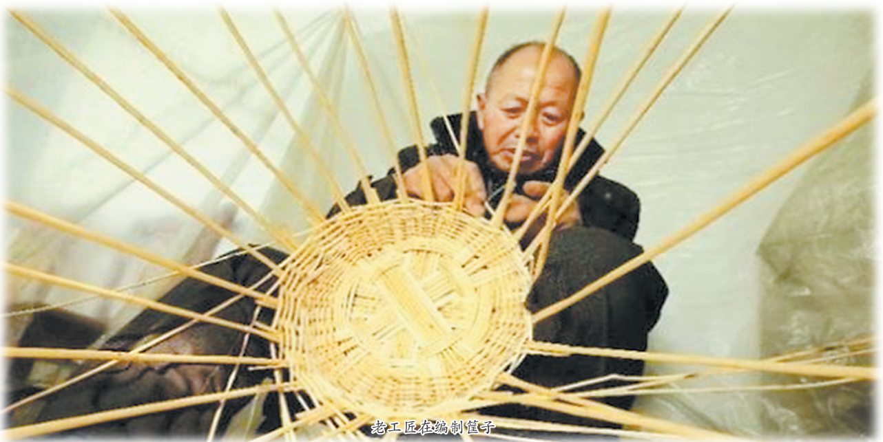
老工匠在编制筐子