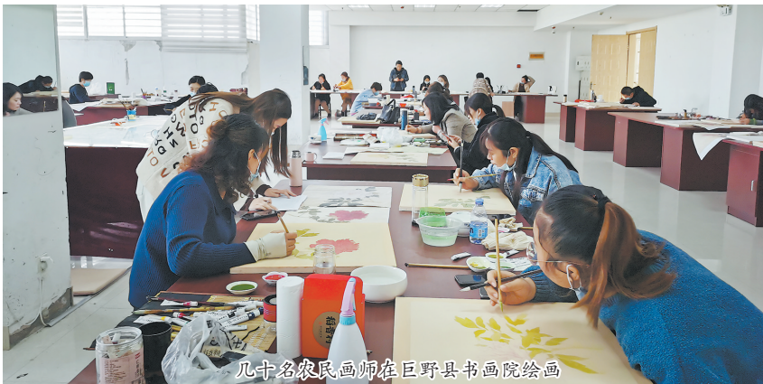
几十名农民画师在巨野县书画院绘画

如今，书画产业不仅成为巨野发展新型经济的发力点，更成为农民提升文化素质、引领乡村文明风尚重要载体。 文/图 通讯员 谢新华