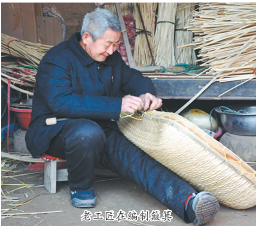
老工匠在编制簸箕