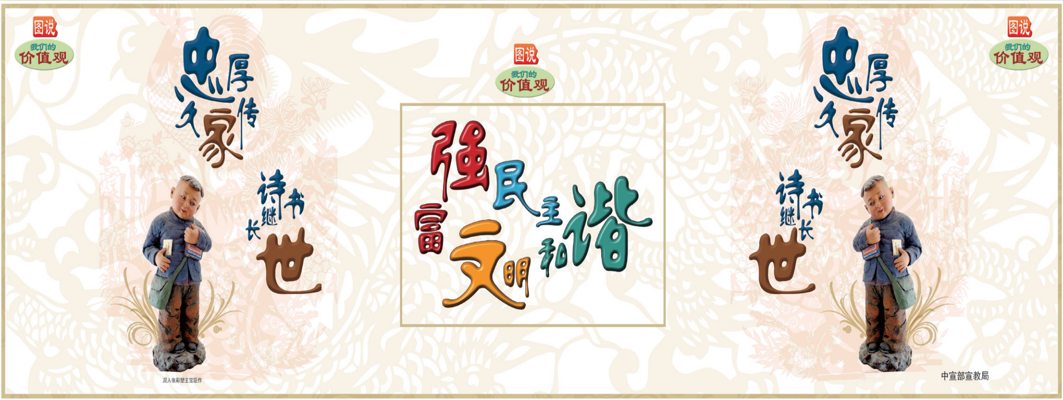
沂人张和璧王宝创作