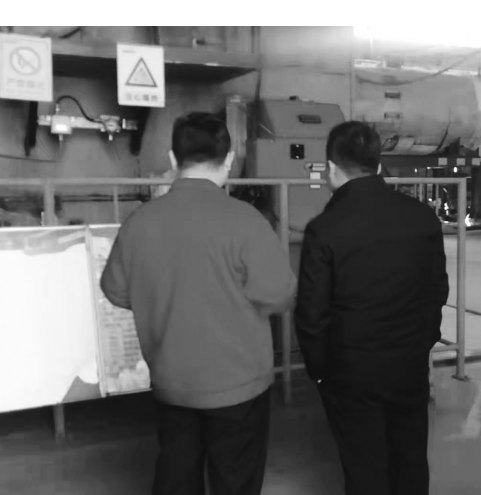
新春伊始,曹县青荷街道组织安监、公安等部门,集中对辖区百通热力、三利轮胎等规模企业集中开展安全生产大检查,对照安全生产规范,逐项核查安全生产措施,确保不留丝毫安全隐患。

多方聚力,织密“保障网”。一是政策发力。制定出台了《曹县特困人员照料服务工作实施方案》,完善分散供养特困人员照料服务政策举措、标准规范和监管机制,推动特困人员救助供养制度落地落实,让特困供养人员享受到政府“兜底式”关怀。二是资金助力。将政府购买社会救助服务经费列入县财政预算,统筹安排社会救助专项资金。自